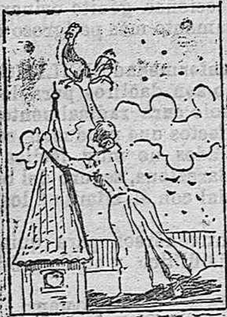
(La solución mañana).