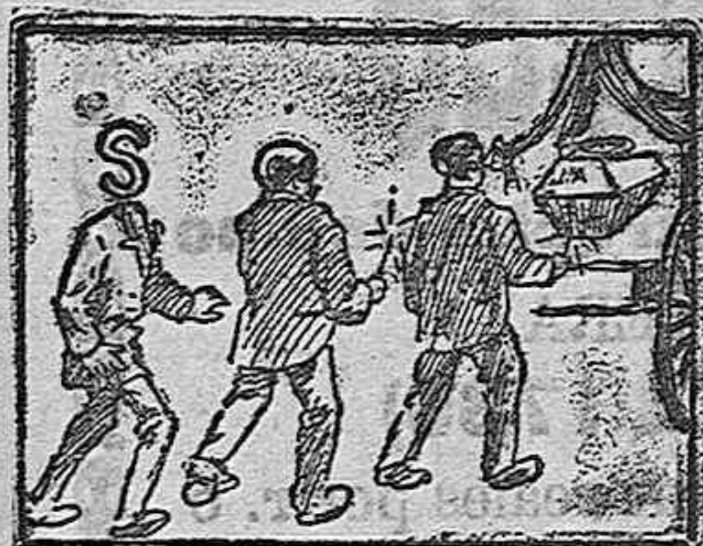
(La solución mañana).