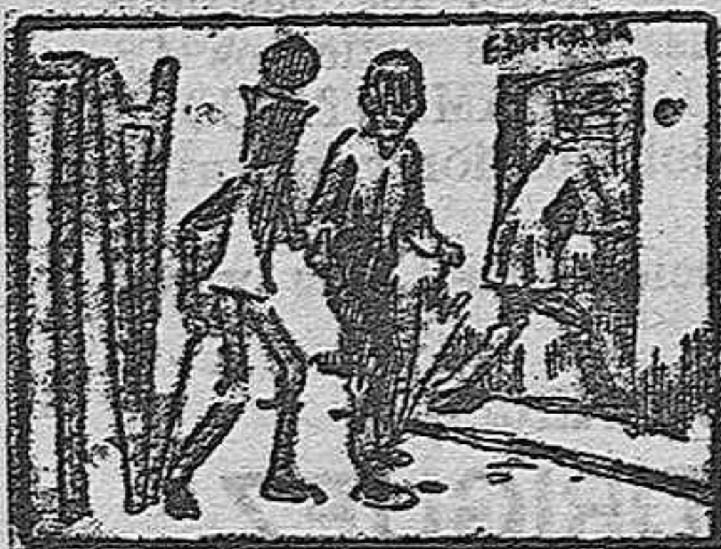
(La solución mañana).