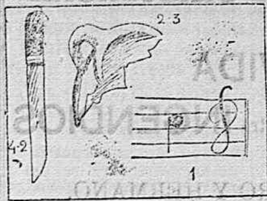
(La solución mañana.)