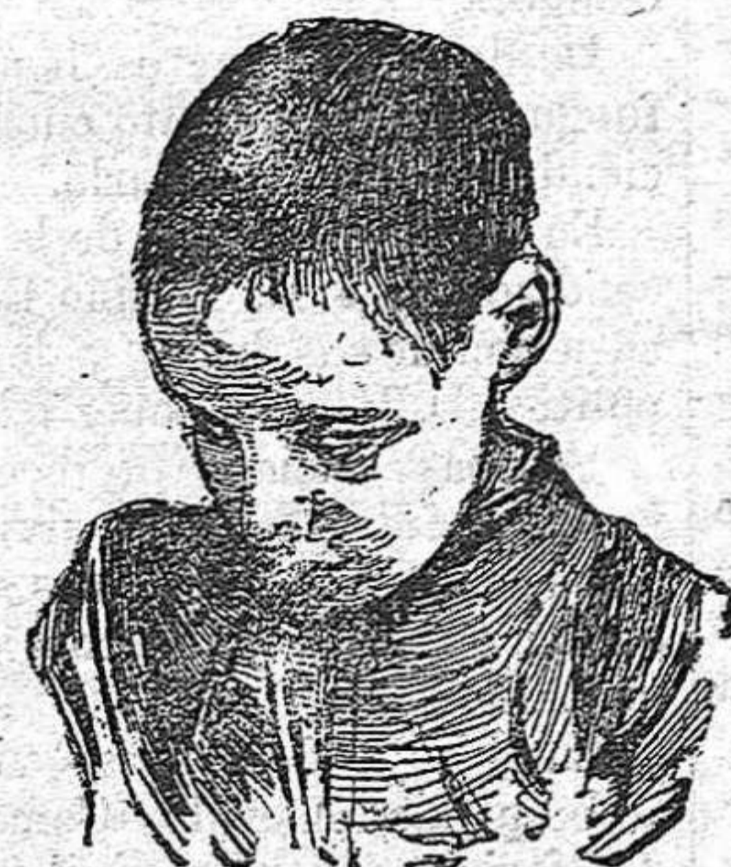
Después de usar el Capilho