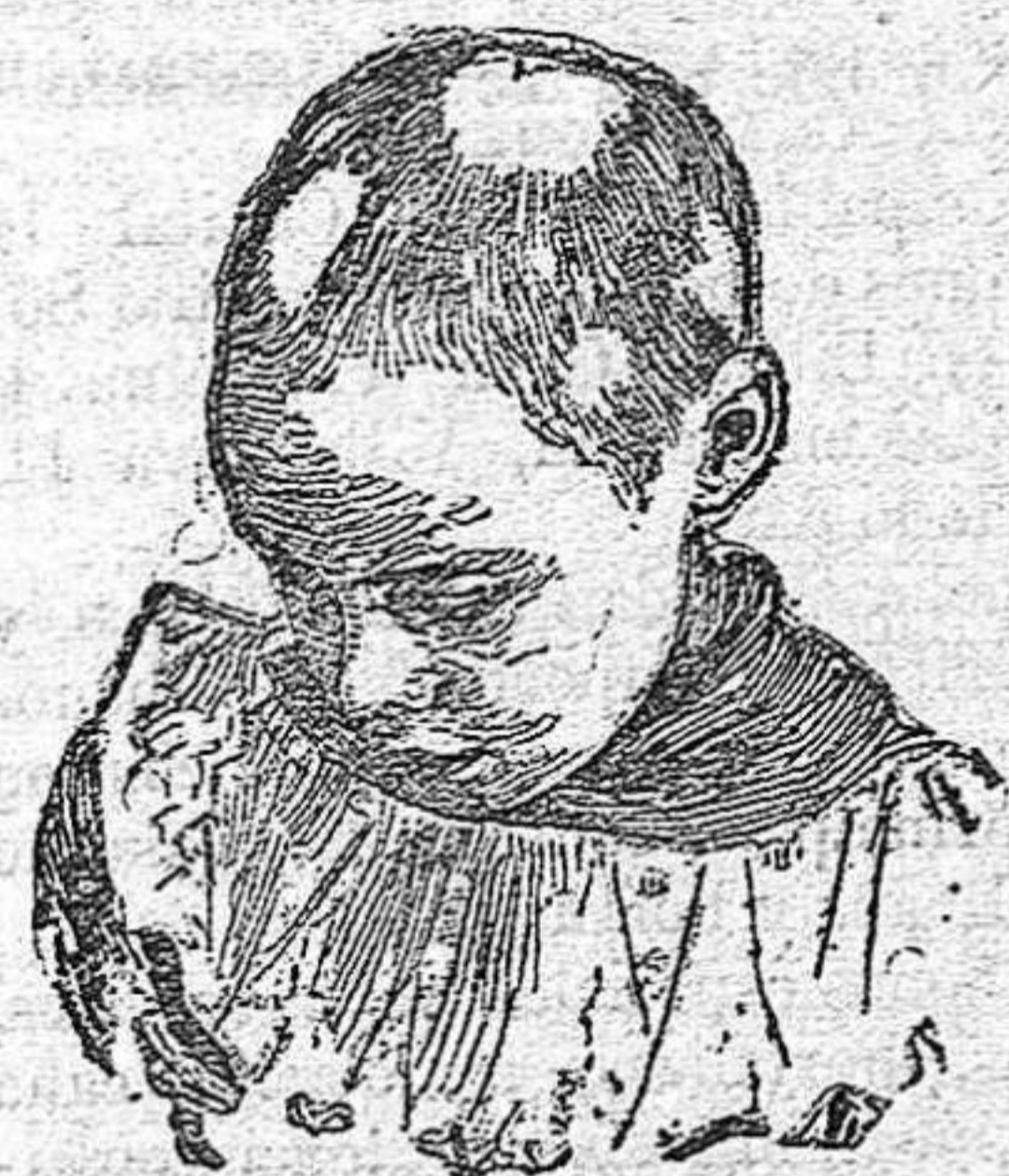
Antes de usar el Capilhol.