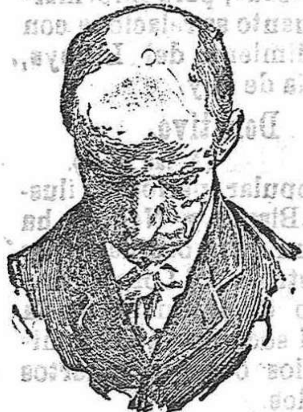
Antes de usar el Capilhol.