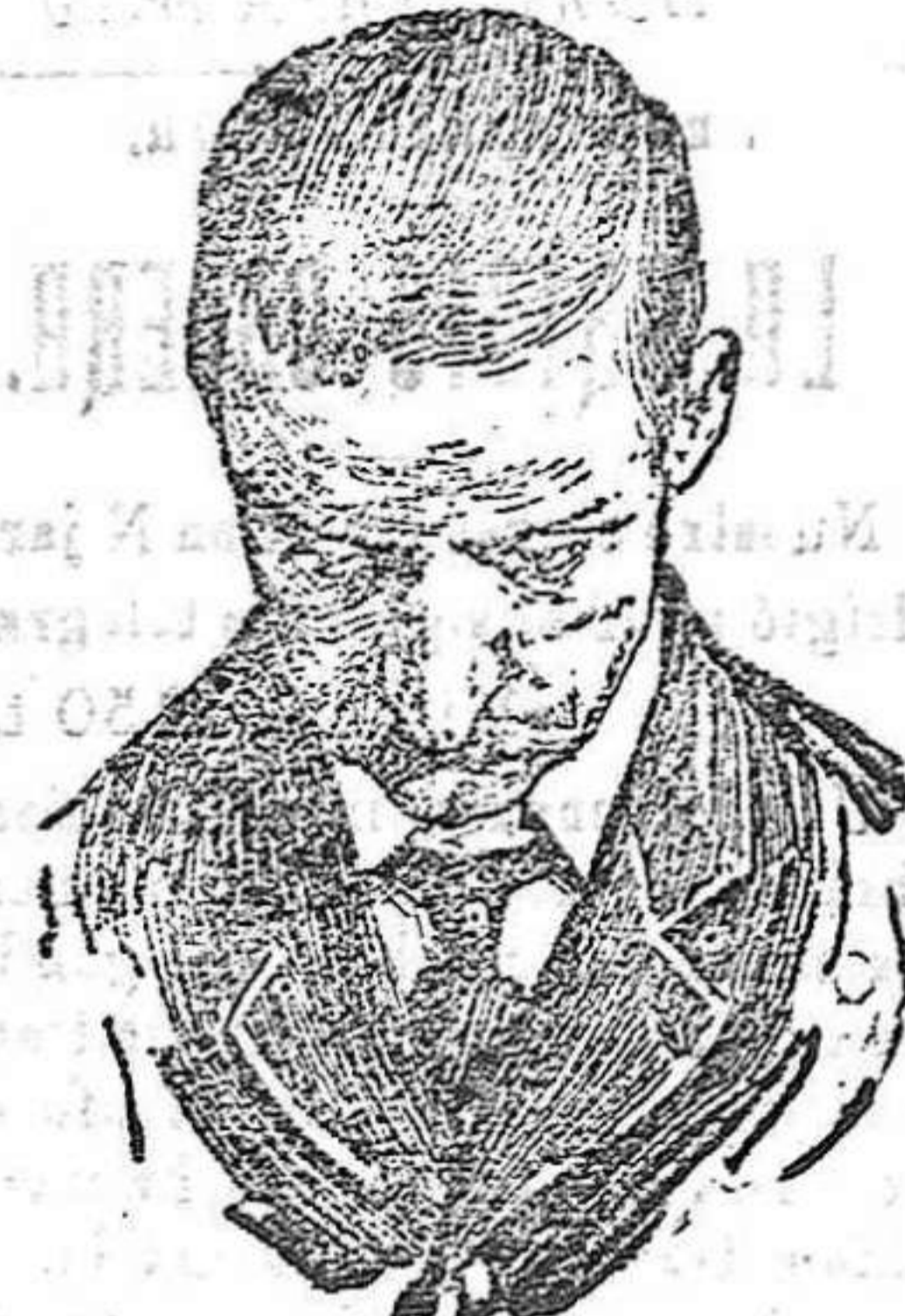
Después de usar el Capilhol