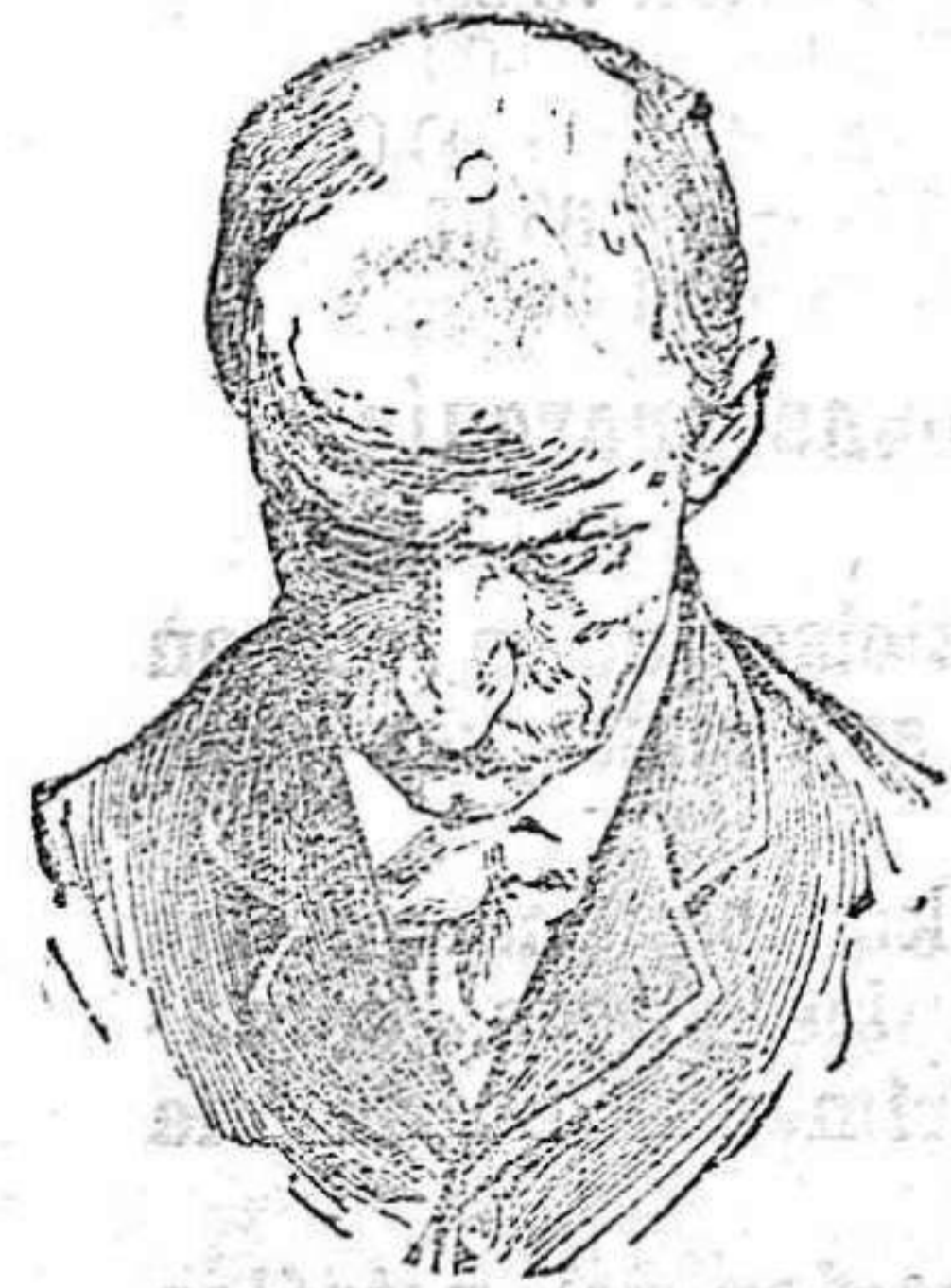
Antes de usar el Capilhol.

res de mesa. Es de éxito seguro en los catarros intestinales de los niños. No solo cura, sino que obra como preventivo, impidiendo con su uso las enfermedades del tubo digestivo. Once años de éxitos constantes. Exíjase en las etiquetas de las botellas la palabra STOMALIX, marca de fábrica registrada. De venta, Serrano 30, farmacia, Madrid, y principales de Europa y América.