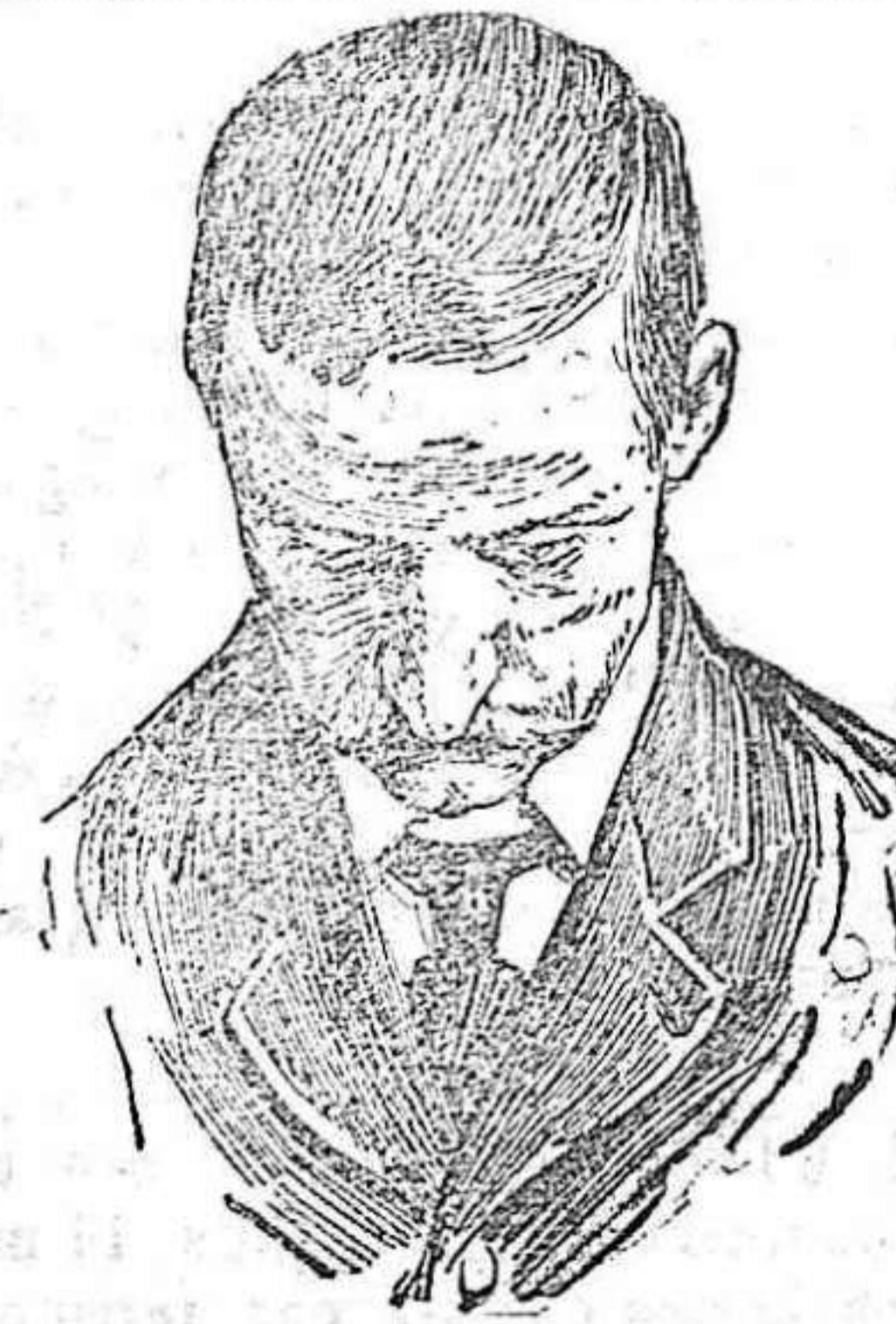
Después de usar el Capilhol