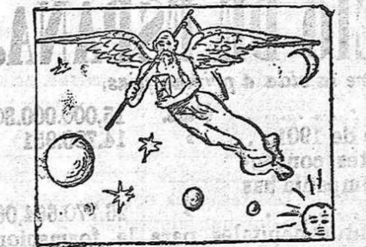
La solución mañana.

Seccion recreativa. Solución á la charada en acción de ayer: Latina. GEROGLIFICO COMPRIMIDO.