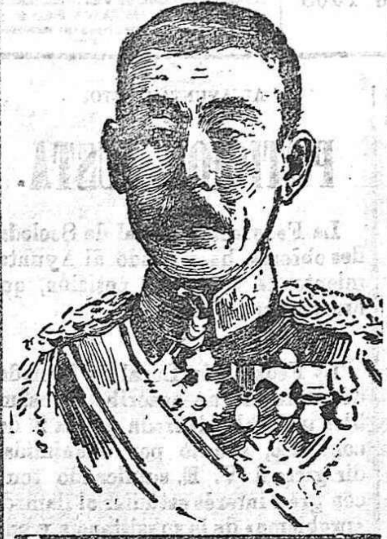
El general japonés Niski, negociador de las capitulaciones de Port Arthur.

cuando los japoneses se encontraron á la vista de la línea de fuertes, el ataque de Puerto Arturo entró en su segunda y última fase.