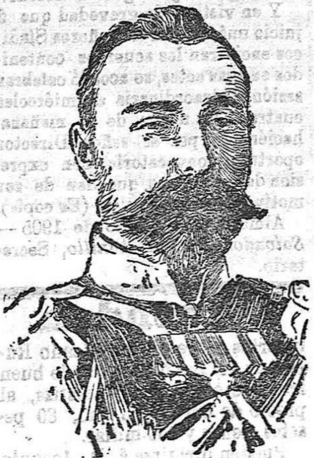
El general Kondrateuhco,

Según noticias oficiales procedentes de Tokio, los ejércitos japoneses han experimentado más de 80.000 bajas en el sitio de la plaza rendida, y si á tan enormes pérdidas se agregan el valor de las municiones gastadas, de los barcos de guerra echados á pique, del material de guerra destruido y los gastos de manutención de los sitiados, todo lo cual, muy prudentemente calculado, excederá con mucho de cien millones de yens, bien puede decirse que el triunfo logrado por el Japon es uno de los más costosos que tiene registrada la historia de los pueblos.