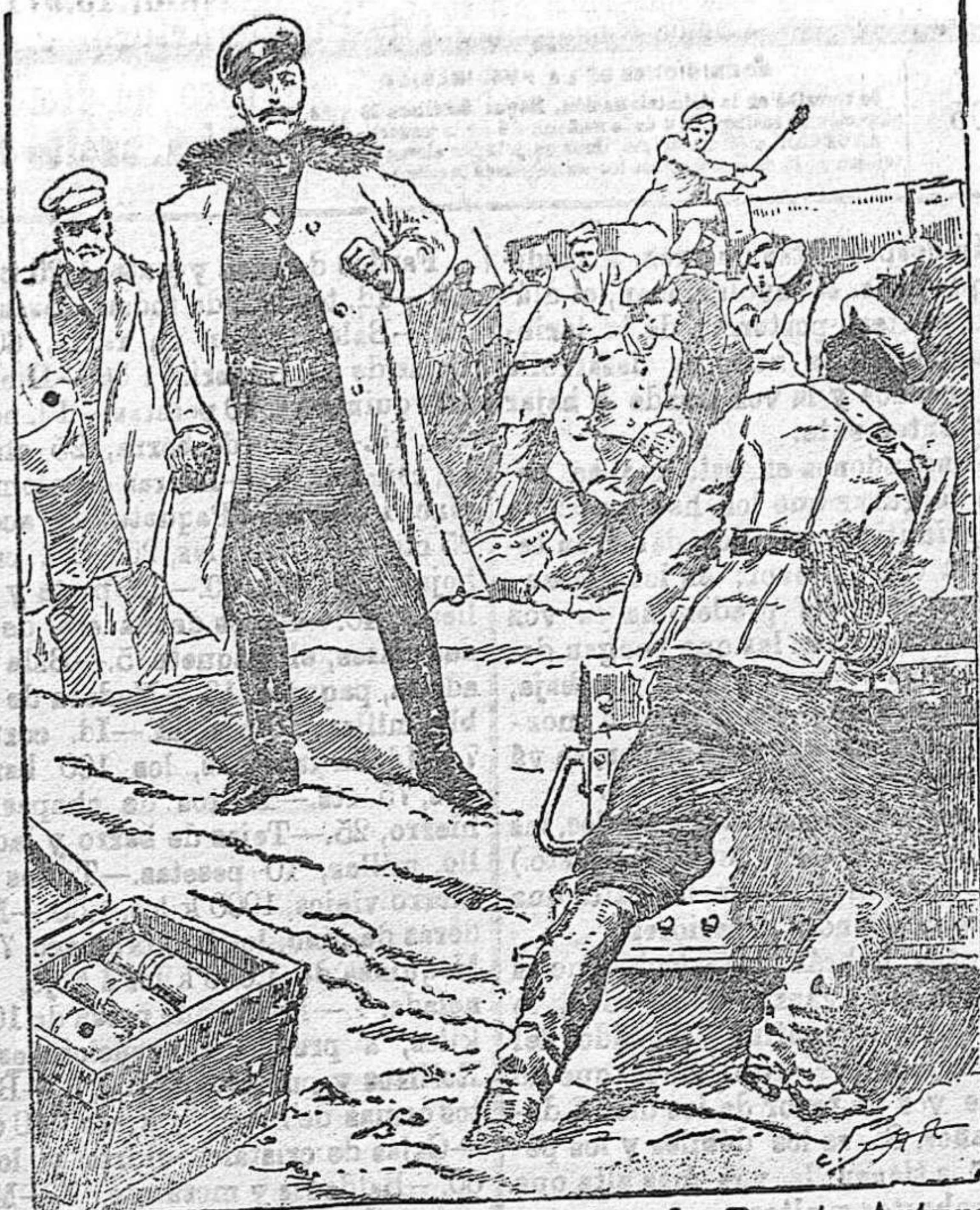
El general Stoessel en las baterías de Puerto-Arturo, dirigiendo la defensa de la plaza.

La noche del 24, saltó, pues la chispa sin razón y sin motivo que lo justificase. No la encendí, ni yo pude provocarla. Yo penetré en referida «casa», en la forma y corrección que acostumbro, en uso de mis atribuciones y en cumplimiento de un servicio, pues tenía confianzas que aquella noche estaba allí dos mujeres, cuya estancia en aquel lugar del vicio se hacía, á mi obligación, intolerable, y cuyas dos señoras, ya están inscriptas en la Sección de Higiene.