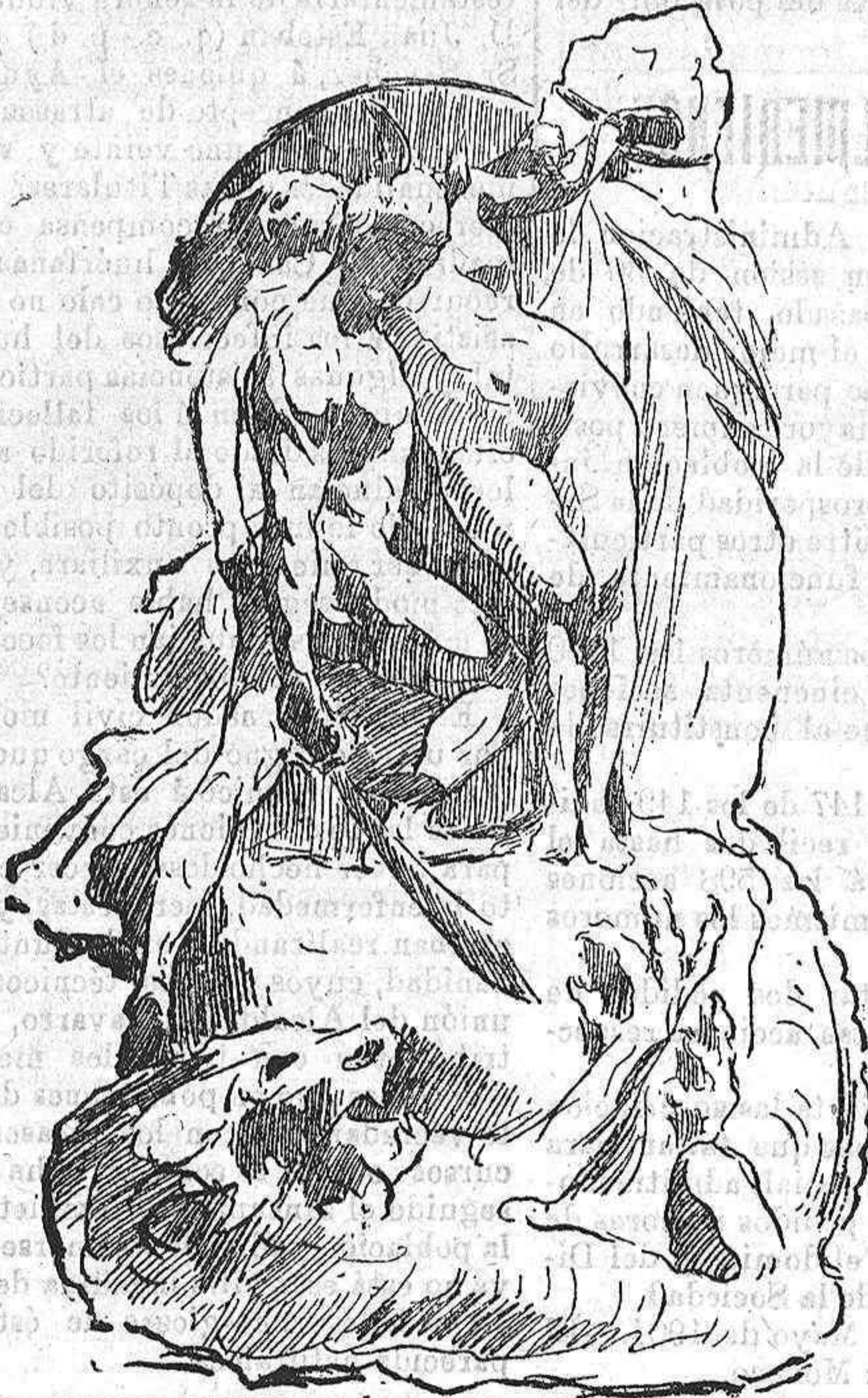
PERSEO Y ANDRÓMEDA.—Apunte del autor

Pero no saquemos ahora á relucir historias viejas y vamos á cuparnos del presente, pero no sin decir antes que aquel triunfo reveló á Trilles como un artista inspi- rado por grandes vuelos y que, al mismo tiempo dió ocasión á que fuera víctima de «malas artes» y de esa influencia política que en España está siempre al servicio de los que solo ampa- rados por ellas pueden vencer, ó mejor dicho, dar satisfacción á sus ambiciones.