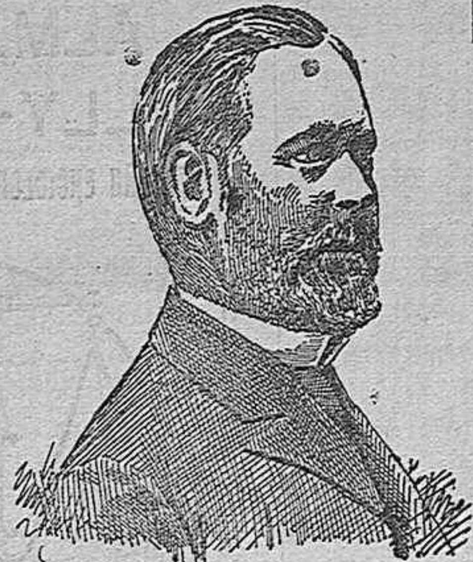
DR. BROUM SEQUARD,

el cual se encuentra en esta población, por asuntos profesionales por breve temporada.