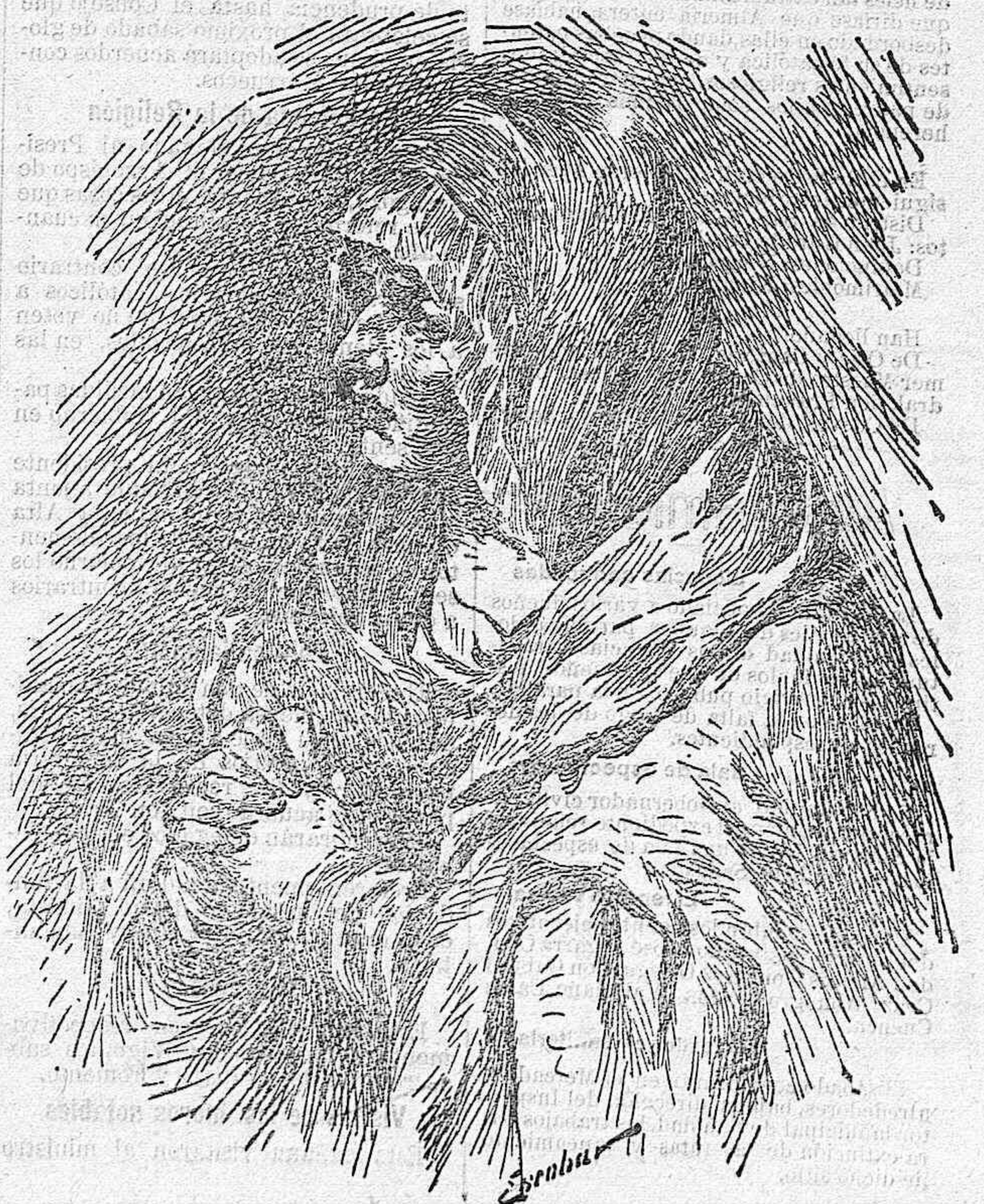
DOLOROSA DEL TIZIANO

Puncemos; hiramos; sangremos... Triste... más triste... muy triste... ¡Inegridad! desdolido... sabroso... placentero... ¿Pla-