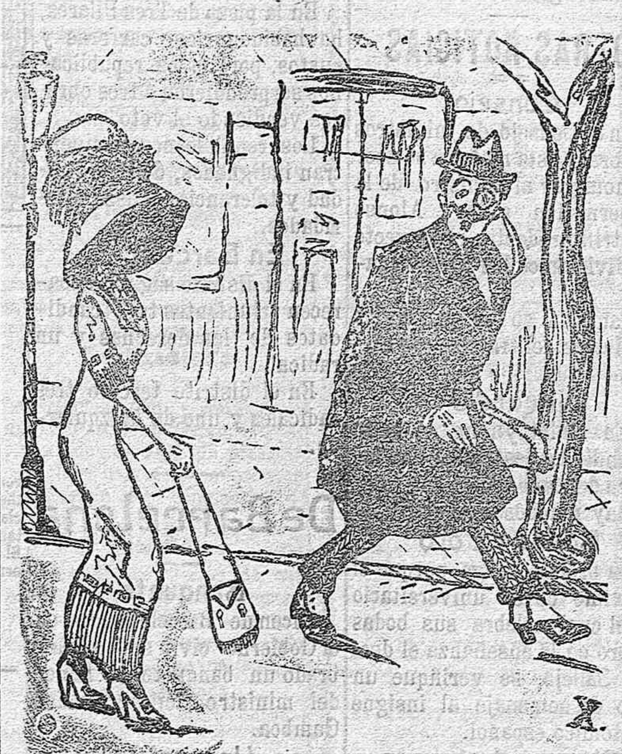
«¡Cielos! Con esas hechuritas, me figuré que era el primer premio de belleza y ahora me resulta una bacalá de Escocia... ¡Huyamos!»