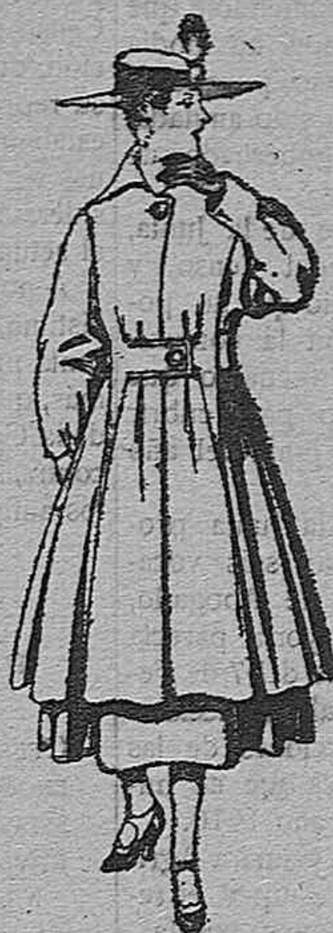
Abrigo de patén, para señora De pesetas 65 a 75.