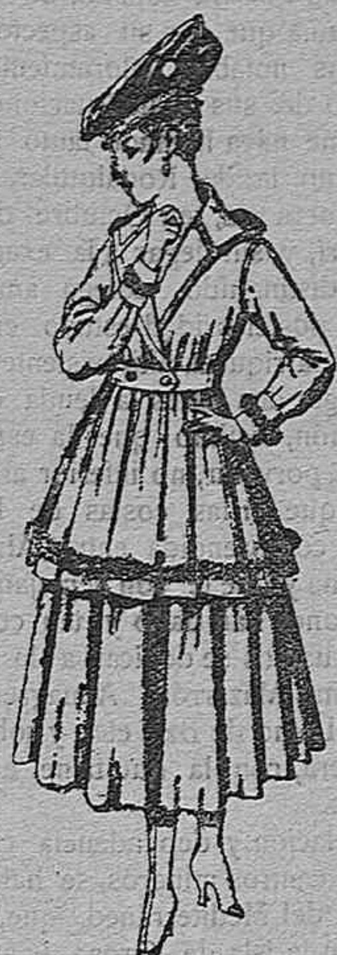
Traje de punto, en color, para señora De pesetas 100 a 130.

Paletaría, Camisería, Géneros de punto, Corbatería, Guantería, Sombrerería, Paraguas, Bastones y Artículos de viaje.