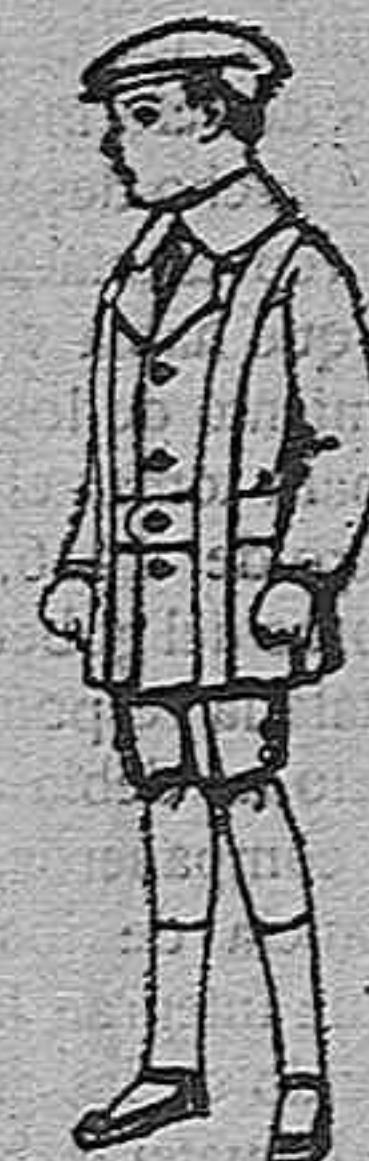
Trajes de patén para niños de 4 a 9 años. De pts. 12 a 33