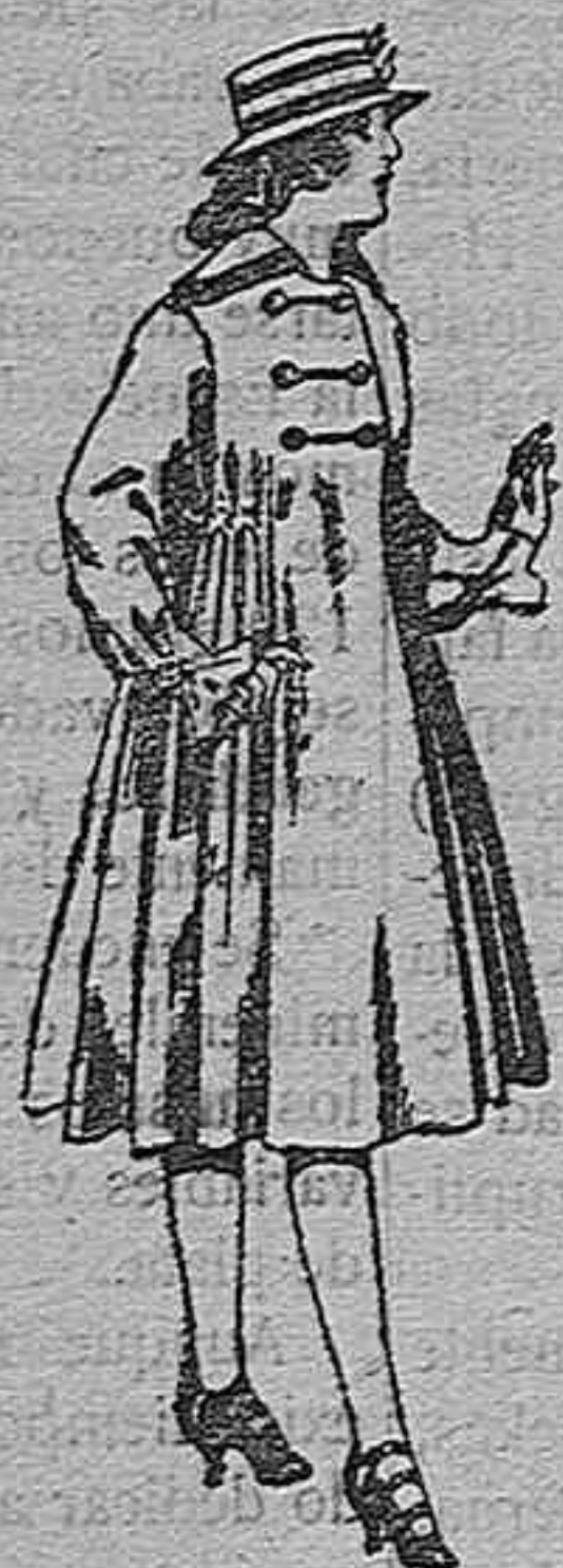
Abrigos de pa para juvenitas de 11 a 15 años De pts 35