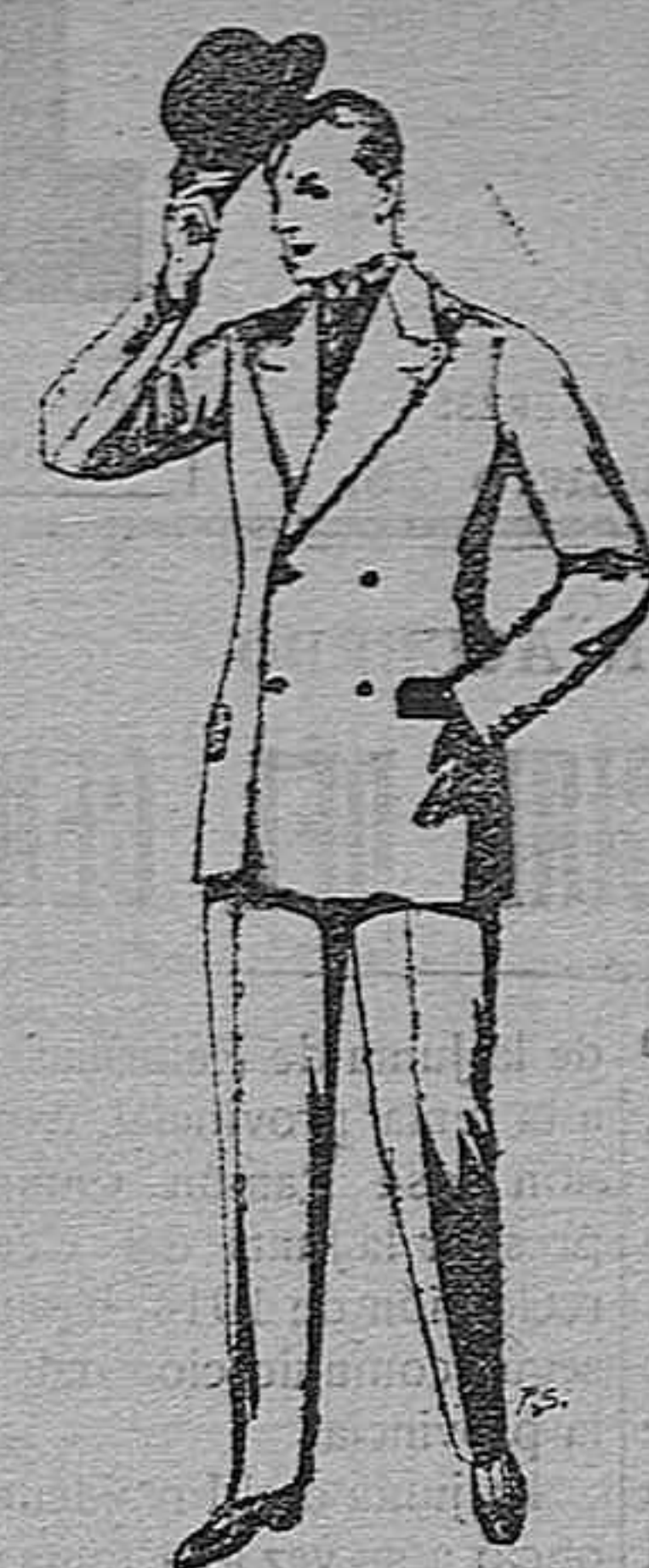
Trajes de chebot, patén, etc. De pesetas 27 a 80. Trajes de vicuña o jerga. De pesetas 30 a 85. Los mismos, a medida. De pesetas 65 a 136.