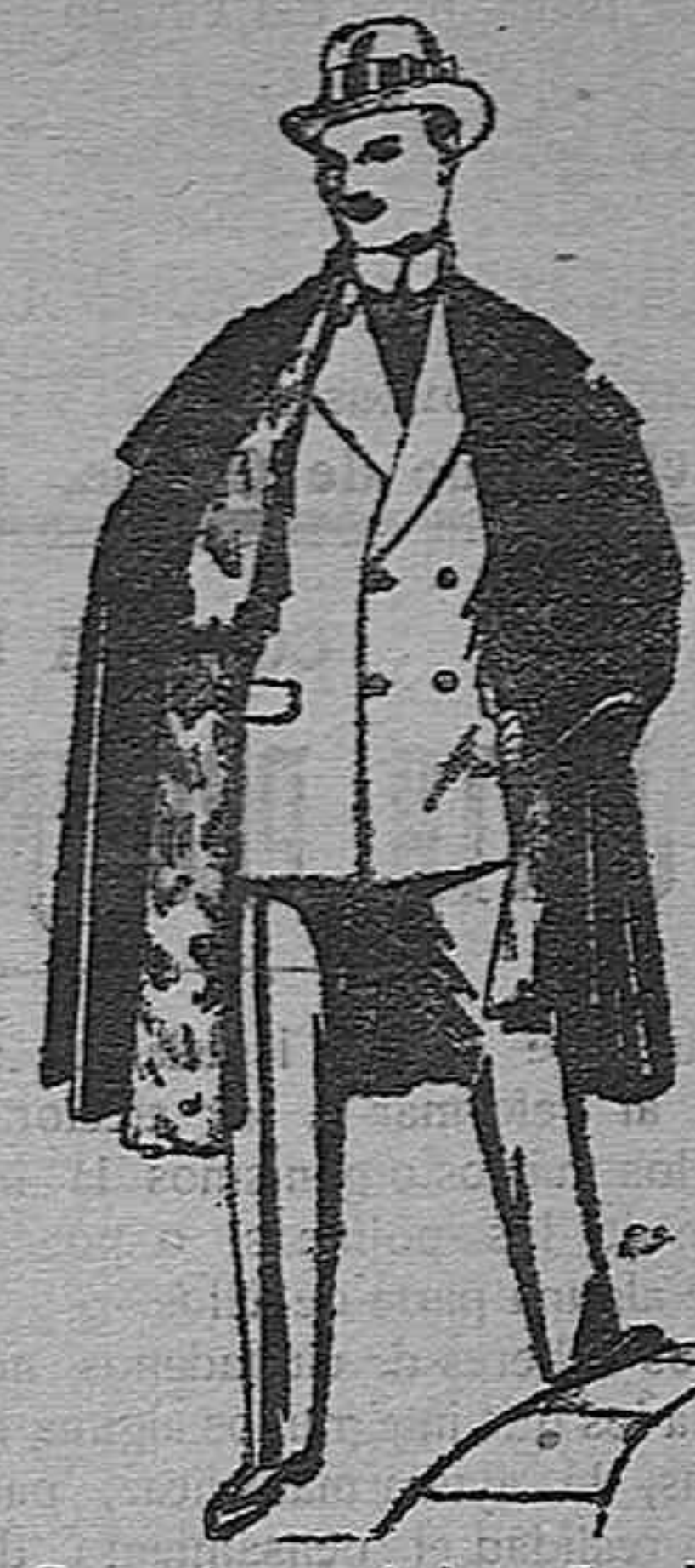
Capas (enteras) de paños de Béjar y Tarrasa, embudos de peluche, terciopelo, astrakán a escocés. De pesetas 35 a 115.