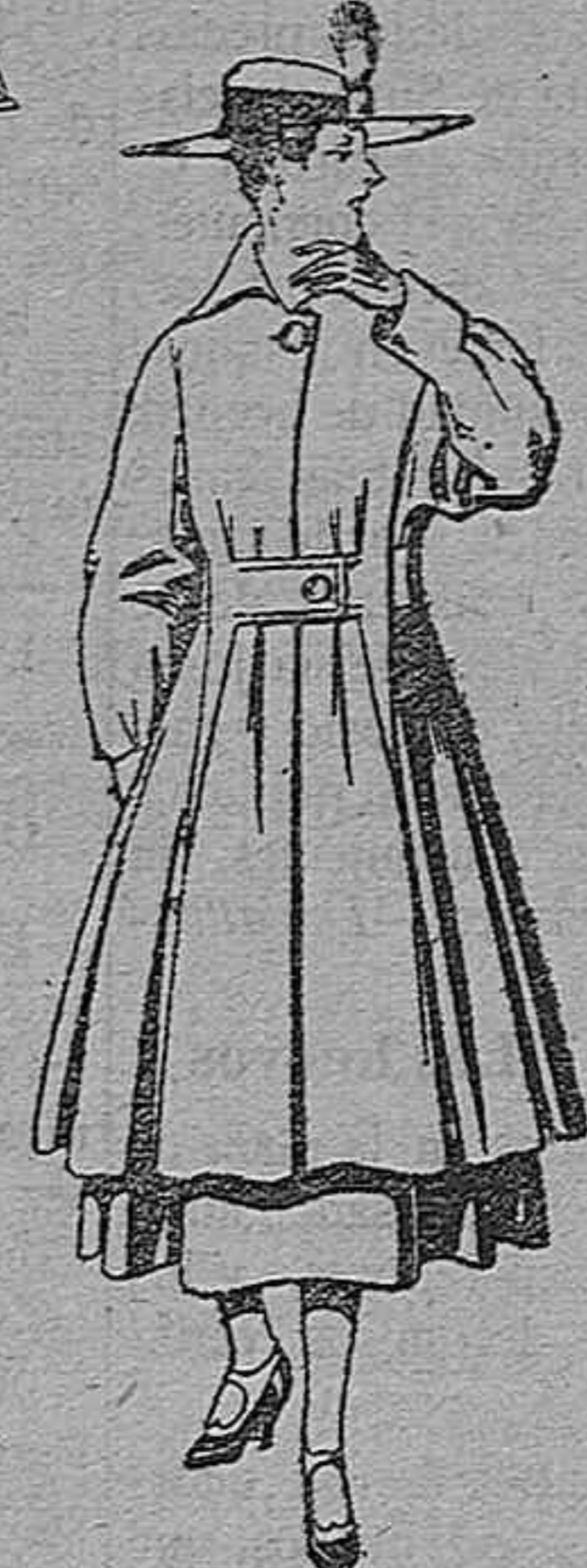
Abrigo de p tén, para señora. De pesetas 65 a 75.