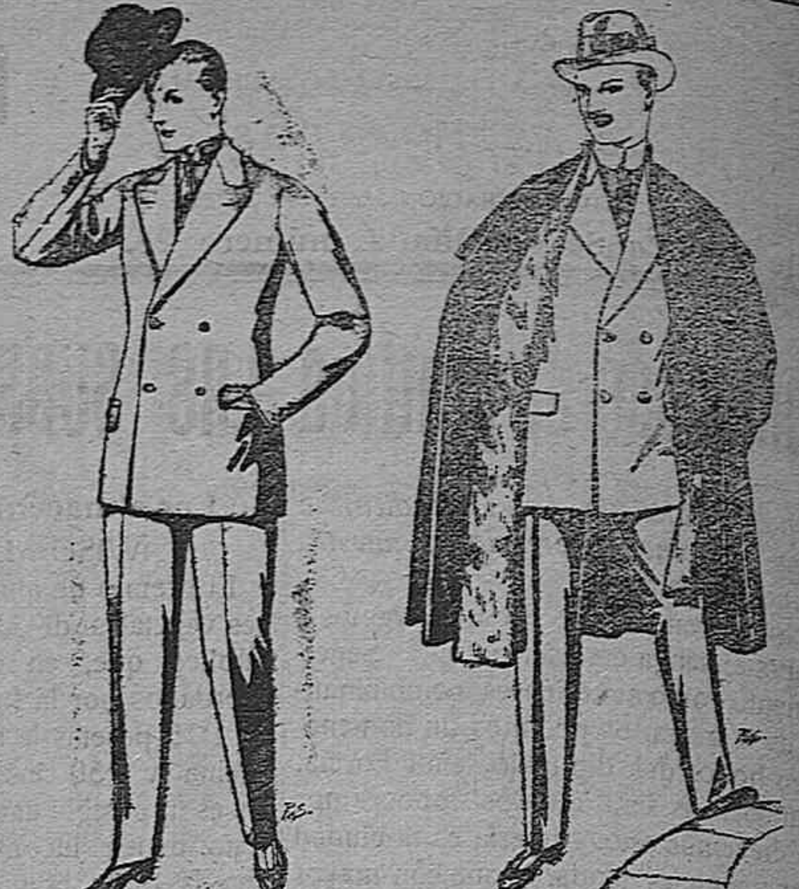
Trajes de cheviot, patén, etc. De pesetas 27 a 80. Trajes de vicuña o jerga. De pesetas 30 a 85. Los mismo, a medida. De pesetas 65 a 136. Capas (enteras) de paños de Béjar y Tarrasa, embezos de peluche, terciopelo, estrakán a escocés. De pesetas 35 a 115.