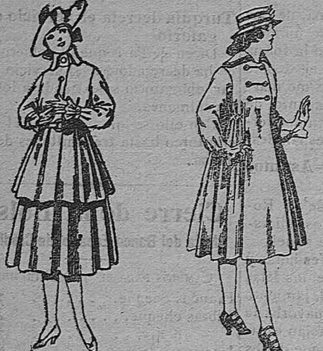
Trajes de lana, para jovencitas de 12 a 15 años. De pts 45 a 55. Abrigos de patén para jovencitas de 11 a 15 años. De pts 35 a 50.