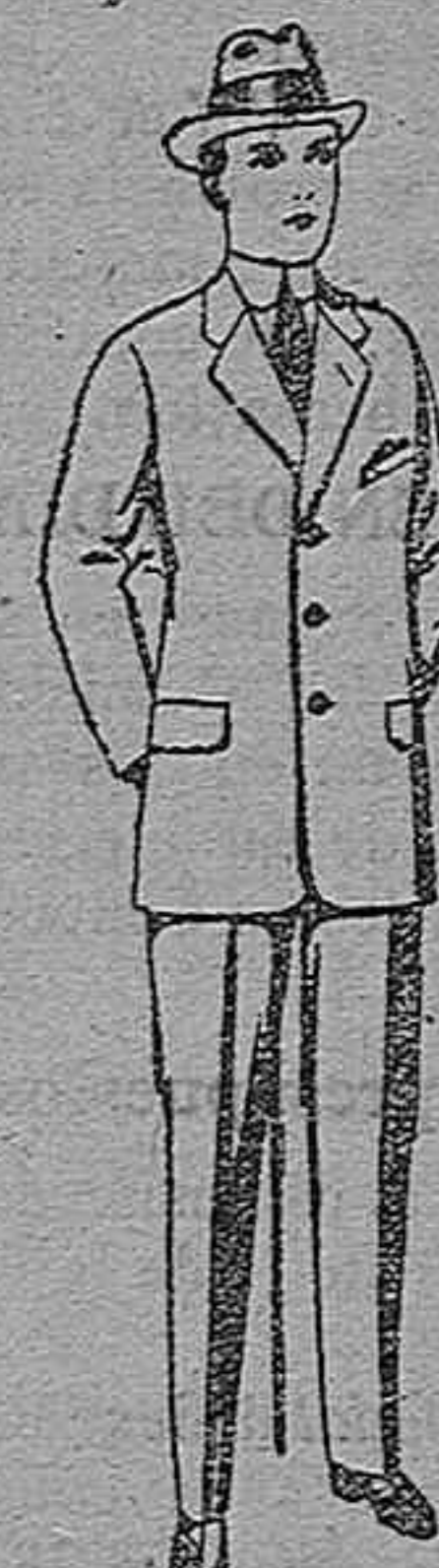
Trajes de patén, vicuña o jerga, para niños de 10 a 12 años. De pesetas 15 a 50.