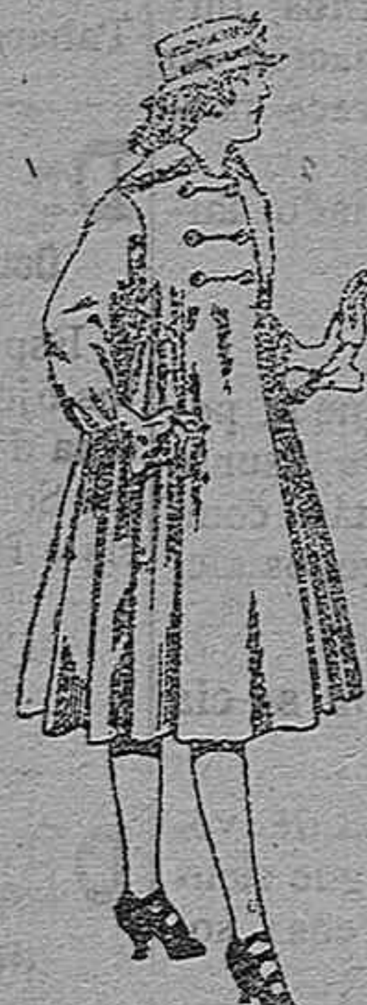
Abrigos de patén para jovencitas de 11 a 15 años. De pts 35 a 50.