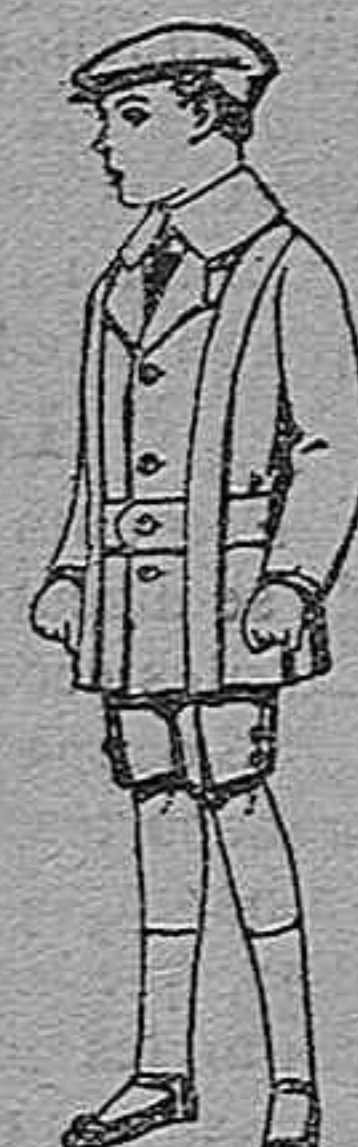
Trajes de patén para niños de 4 a 9 años. De pts. 12 a 33