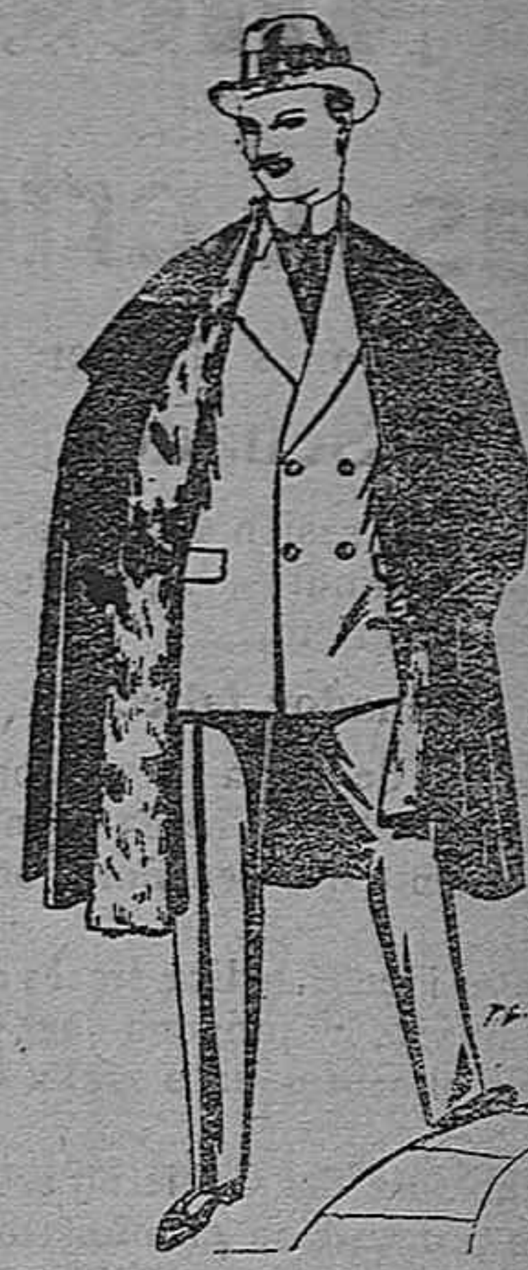
Capas (enteras) de peños de Béjar y Terrasa, embros de peluche, terciopelo, astracán a esocé. De pesetas 35 a 115.