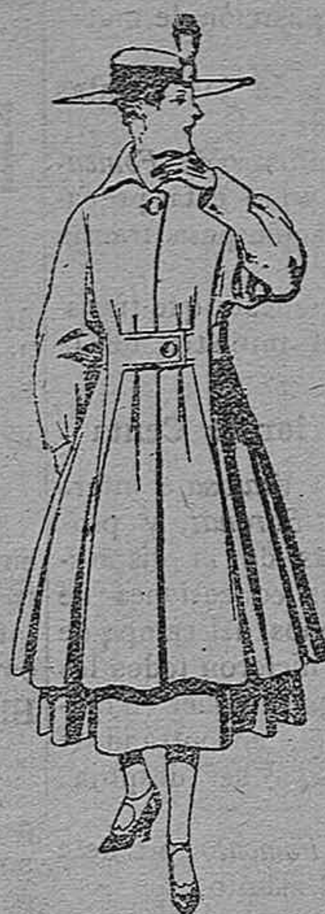
Abrigo de patén, para señora. De pesetas 65 a 75.