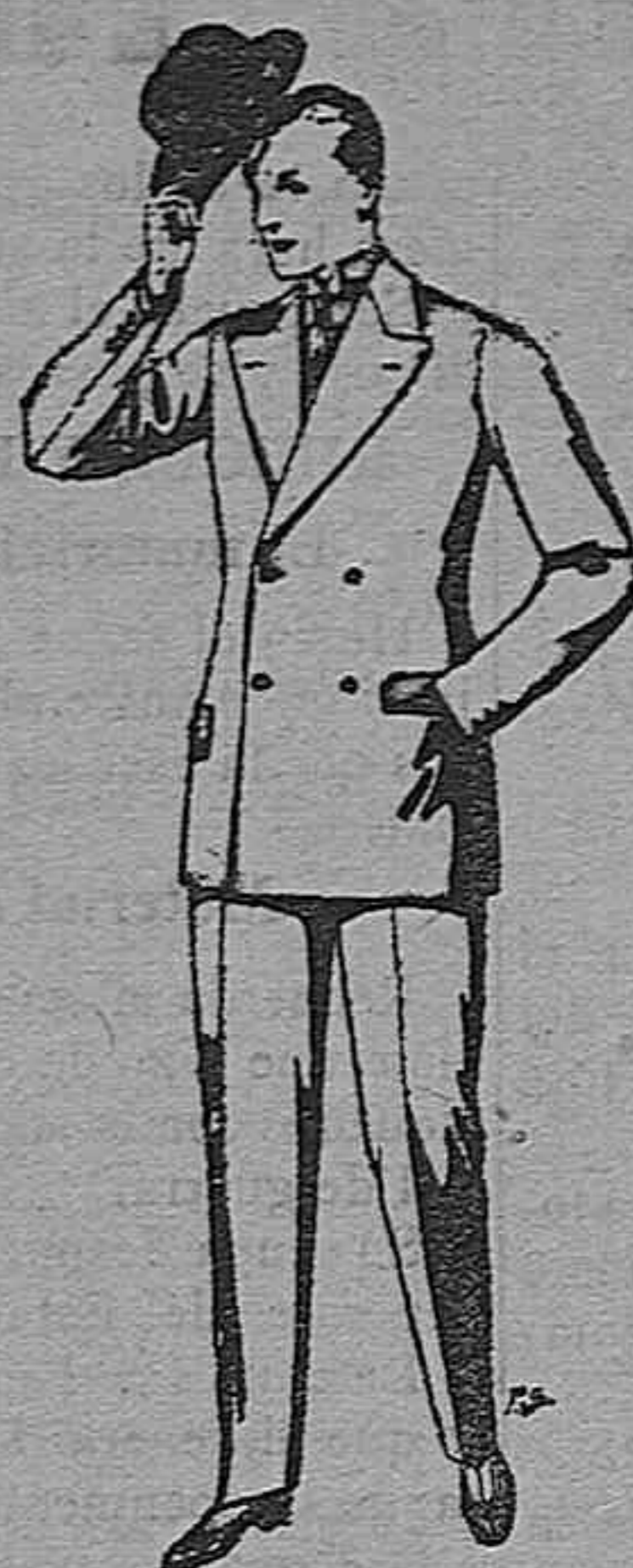
Trajes de cheviot, patén, etc. De pesetas 27 a 80. Trajes de vicuña o jerga. De pesetas 30 a 85. Los mismos a medida. De pesetas 65 a 136.