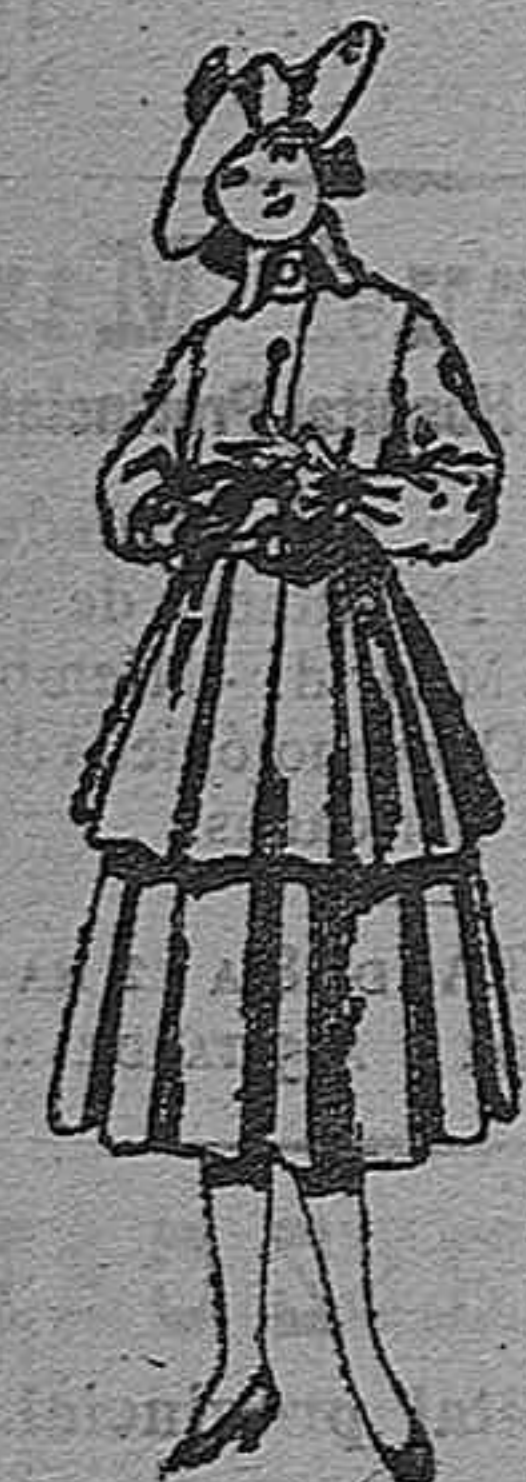
Trajes de lana, para jovencitas de 12 a 15 años. De pts 45 a 55.