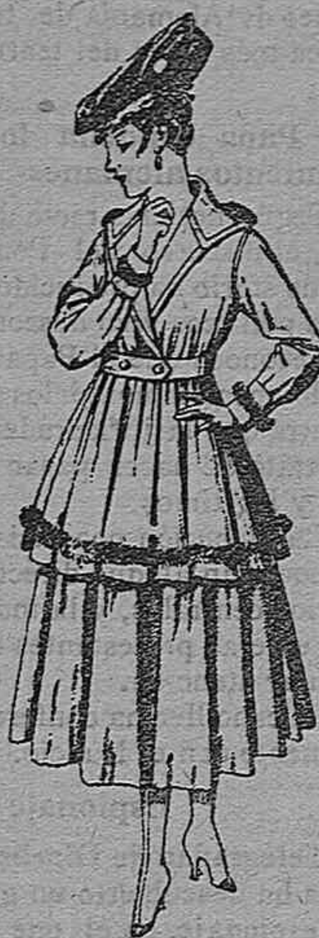
Traje de punto, en color, para señora. De pesetas 100 a 130.