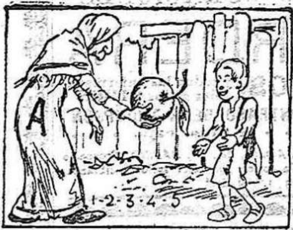
(La solución mañana.)