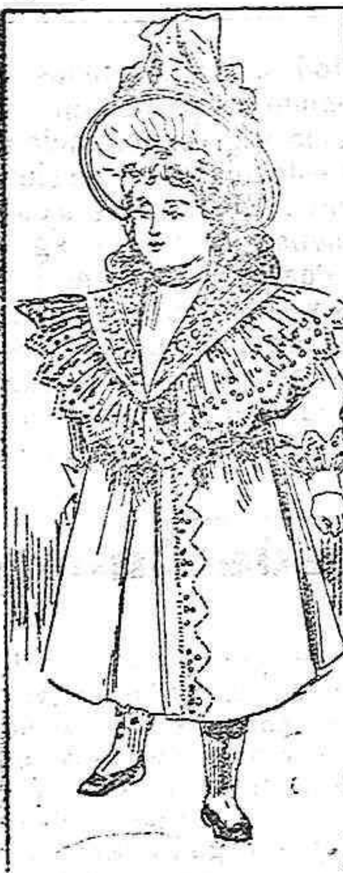
Traje para niña de 1 á 3 años.

Modelo exclusivo para nuestras lectoras de los Grandes Almacenes de «El Siglo», Barcelona.