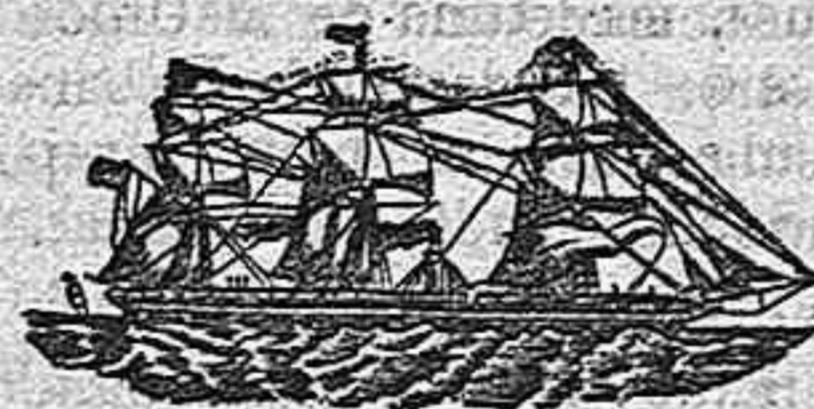
Vapor Manuel Espaliu