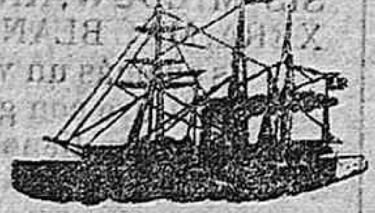
El magnífico vapor

ACADEMIA DE MATEMÁTICAS DIRIGIDA POR D. TOMÁS ALONSO, BACHILLER Y MAESTRO Trajano 3, pral. Horas de clase, de 4 á 6.