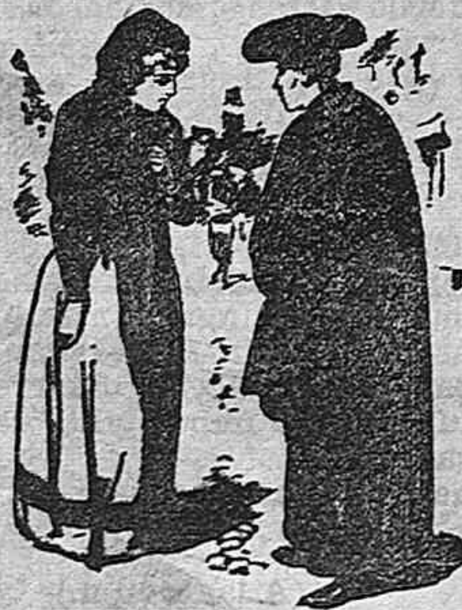
Una devota del santo.

—Padre cura, padre cura, alivie mis hondos males. —¿Qué te sucede, hija mia? —No sé qué en mi pecho arde. —¿Será nubecilla leve? —No, señor.