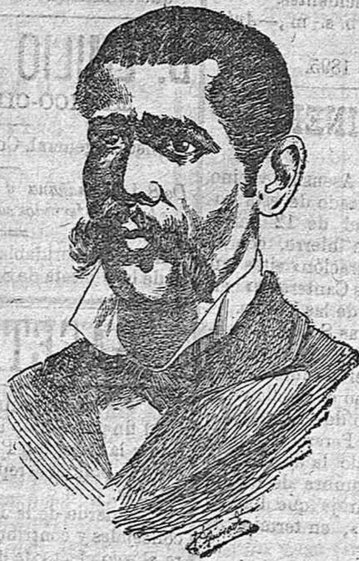
ANTONIO MACEO, CABECILLA CUBANO.

Ampliamos los detalles que nos comunicó nuestro corresponsal por telé-