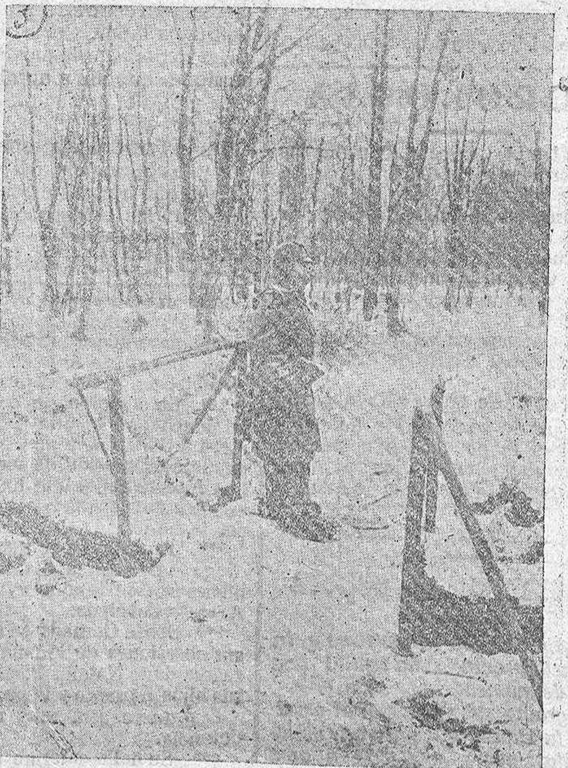
El ejército austrohúngaro.—Puesto de observación en una altura.

Procuro disipar la impresión penosa que tal cuadro ofrece y me tumbo entre