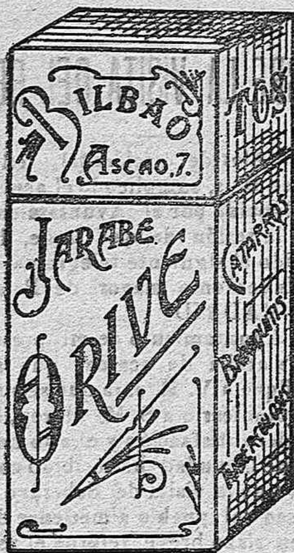
La gravedad de su mal está en esa tos que la cace pasajera y curará radicalmente con Jarabe Orive.