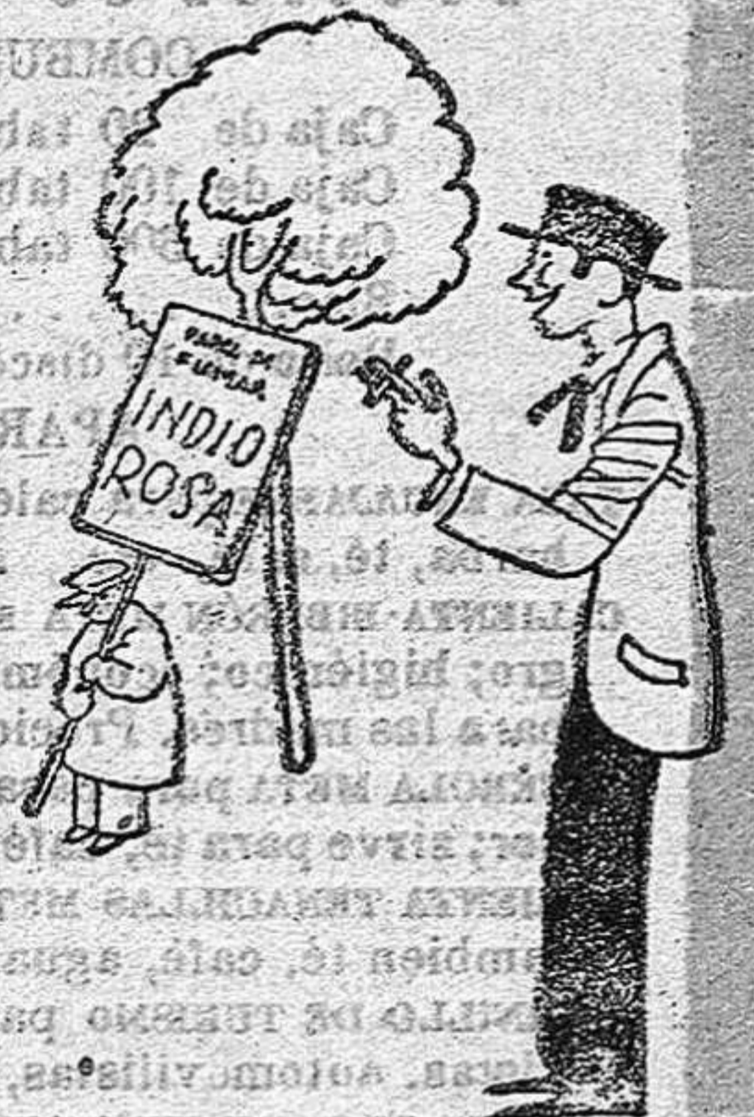
INDIO ROSA es el papel que goza de más cartel.