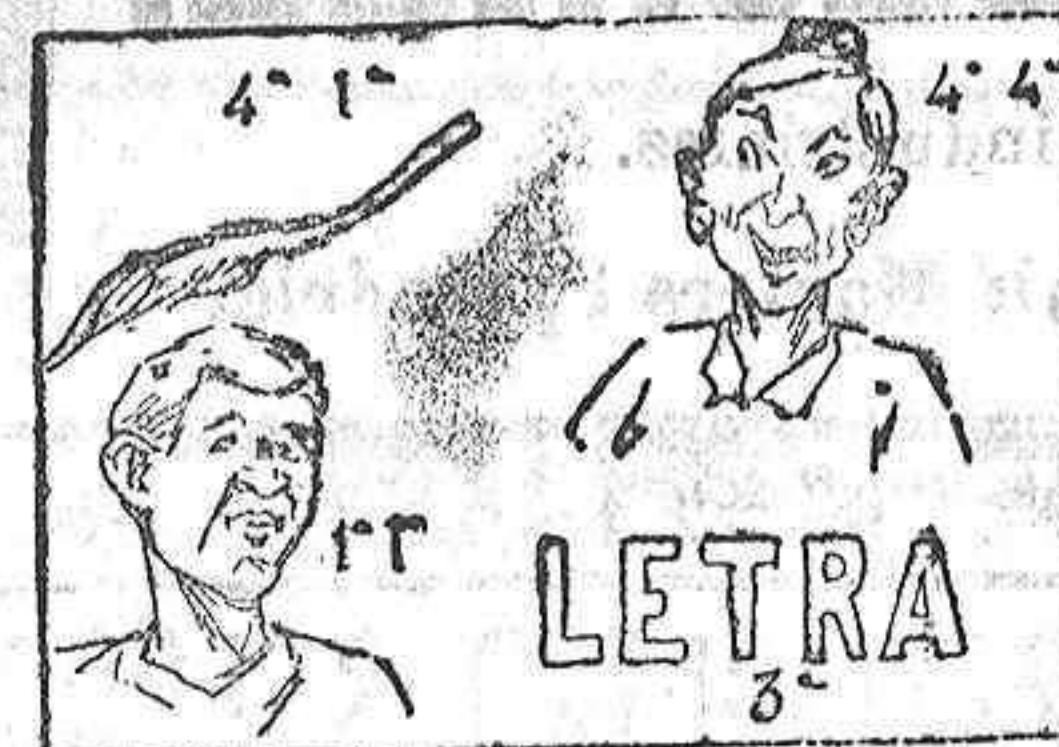
(La solución mañana.)