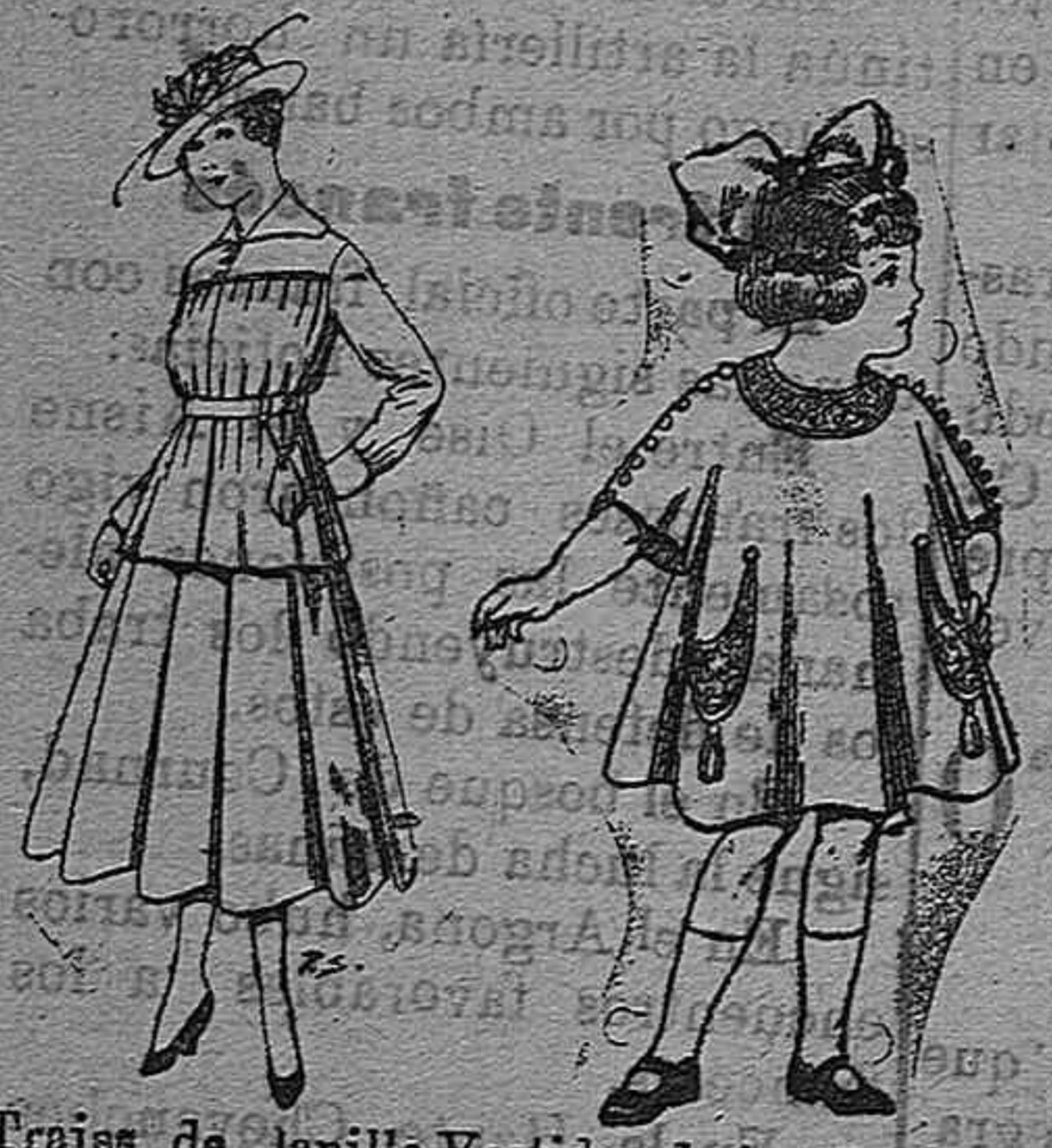
Trajes de lanilla Vestidos de lanilla para niñas de 4 á 9 años. De pesetas 13 á 19. Pt. 50 á 55. De pesetas 30 á 38.