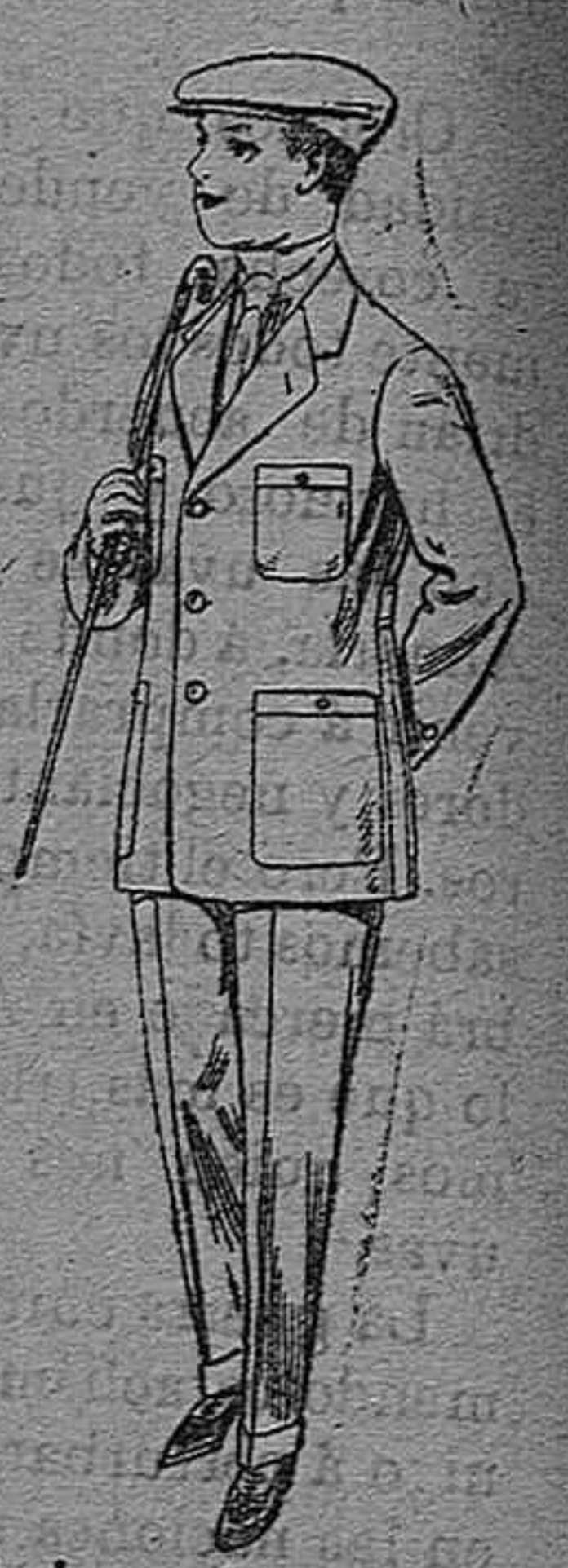
Trajes modelo Sport de dril listado para jovencitos de 10 á 16 años. De pesetas 11 á 17.

CAMISERIA, GÉNEROS DE PUNTO, CORBATERIA, SOMBRERERIA, ZAPATERIA, PARAGÜES, BASTONES Y ARTÍCULOS DE VIAJE