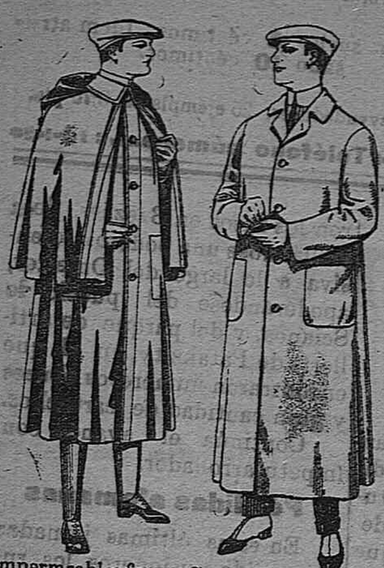
Impermeables forma Guardapolvos de dril macfarland en negro y azul. De pesetas 55 á 100. De pesetas 6 á 11.