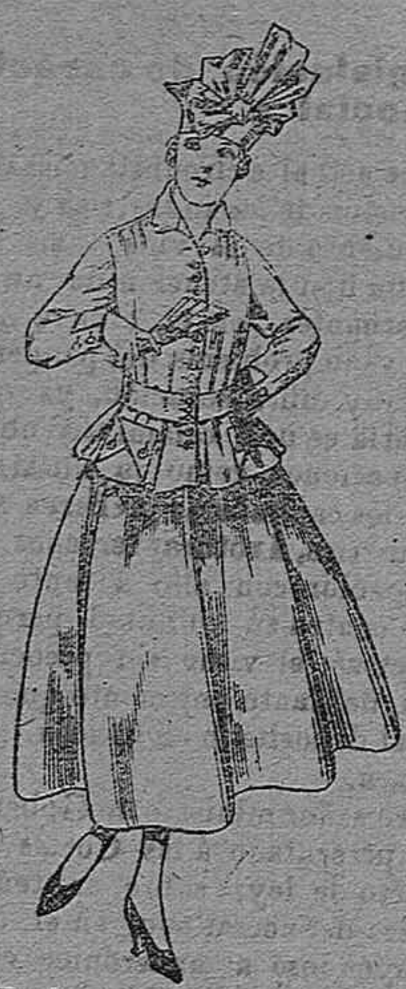
Trajes de lanilla negra, azul y color. A pesetas 70.