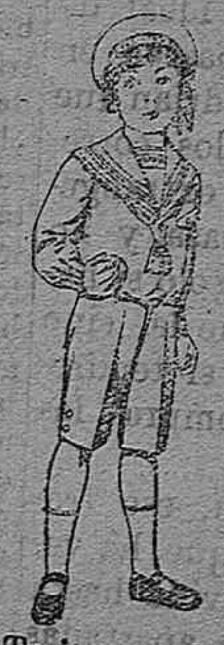
Trajes marinera de vicuña azul, para niños de 4 á 9 años. Pt. 6 á 20.