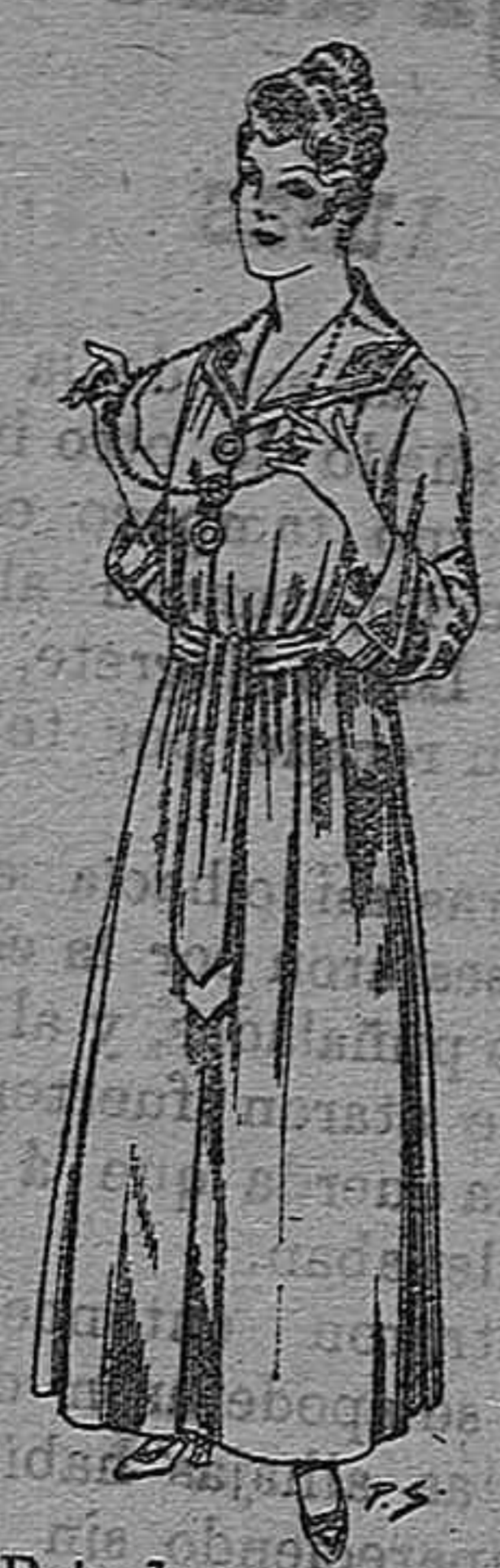
Bata de crepón color, cuello bordado. De pesetas 6 á 11.