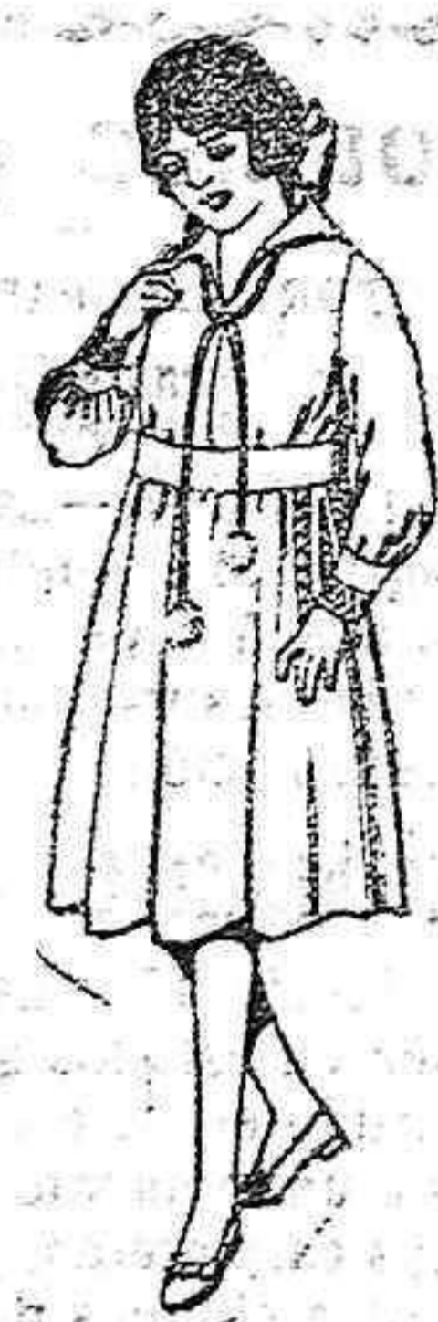
Vestidos de gabardina o estambre azul, bordados, para niñas de 4 a 9 años, de pesetas 25 a 30.