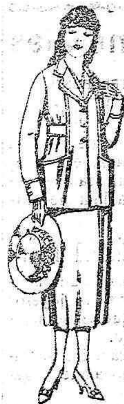
Trajes de estambre, gabardina, etc., en azul y color, de pesetas 48 a 58.