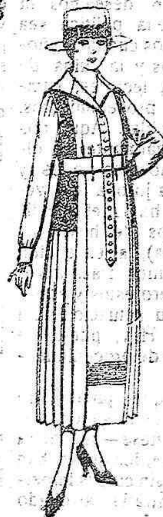
Vestidos de velo de algodón, blanco, bordados, de pesetas 40 a 50