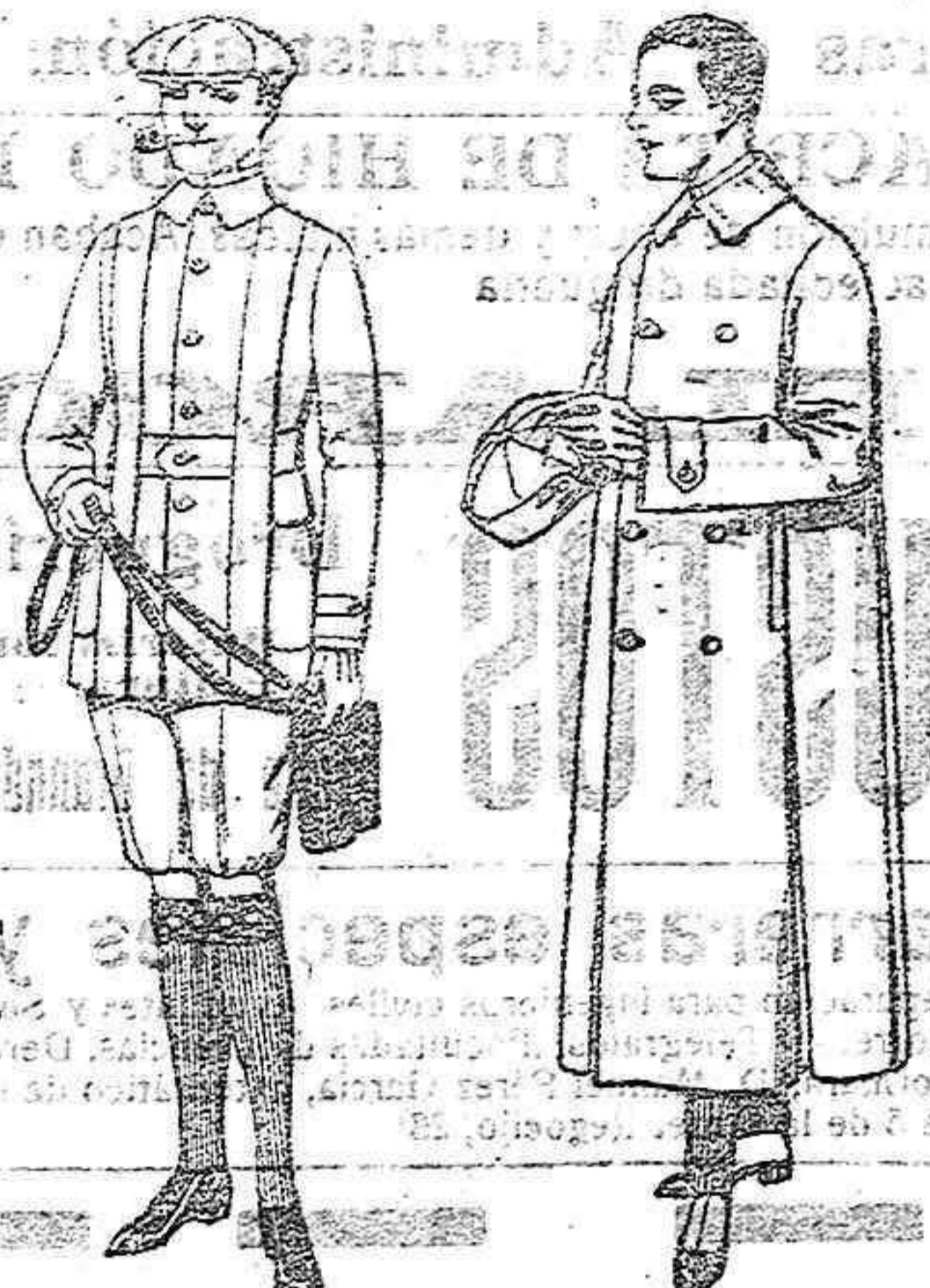
Cazadoras de drill crudo o kaki, de pesetas 15 a 18.