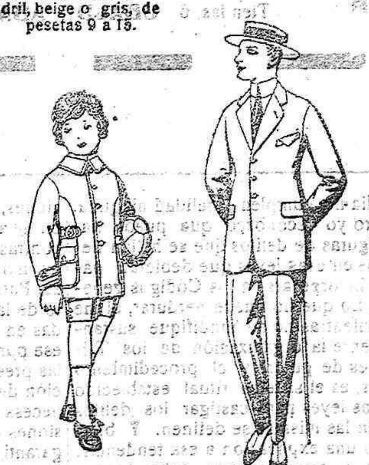
Trajos de lana, melton, etc., para niños de 4 a 9 años de pesetas, 20 a 32.