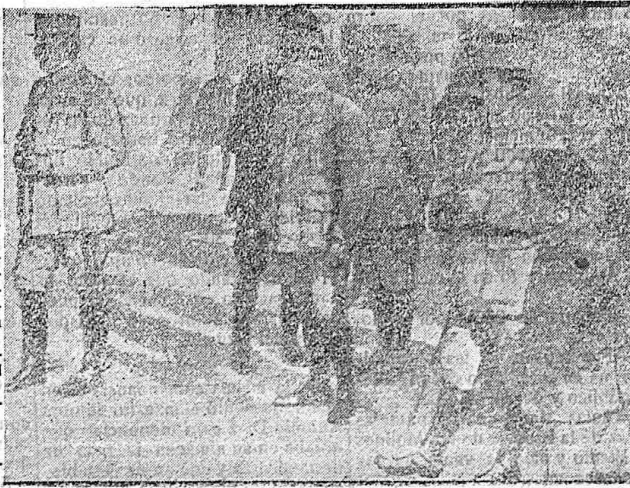
EL GENERAL MAISTRÉ PRESENCIANDO EL DESFILE DE LOS PRISIONEROS HECHOS EN MONTAÑES