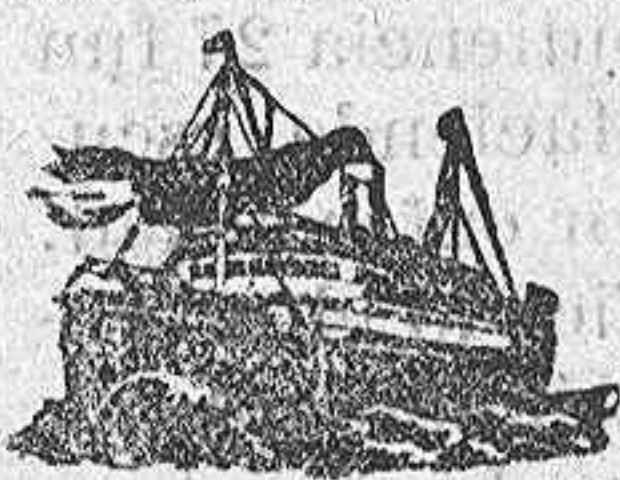
El correo trasatlántico