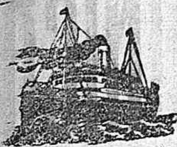
El correo trasatlántico