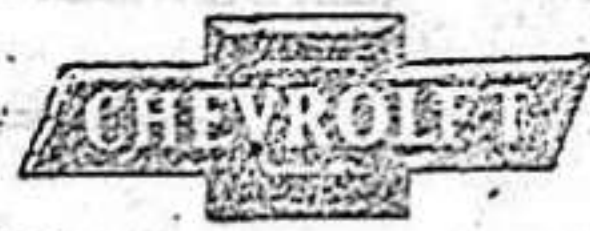
Para transporte económico

Un motor robusto de válvulas en la culata rinde sorprendente potencia y solidez, libre de toda vibración, sea cual fuere su velocidad. Una transmisión suave de la fuerza motriz a través de su caja de cambio normal de tres velocidades evita todo esfuerzo en el motor y prolonga su duración.