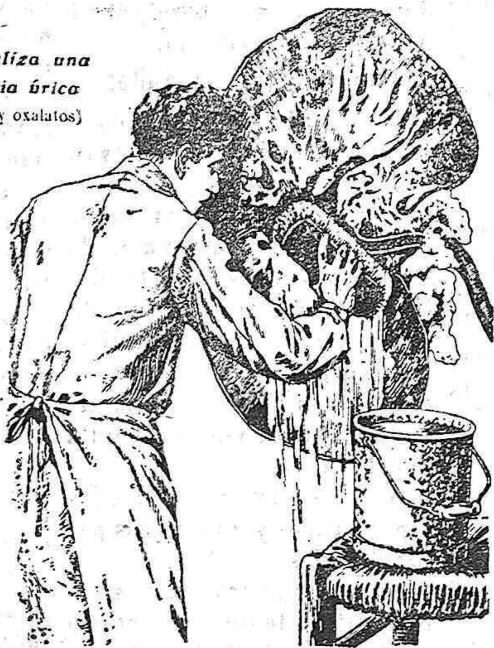
Exigir la marca depositada: EL HOMBRE DE LAS TENAZAS.