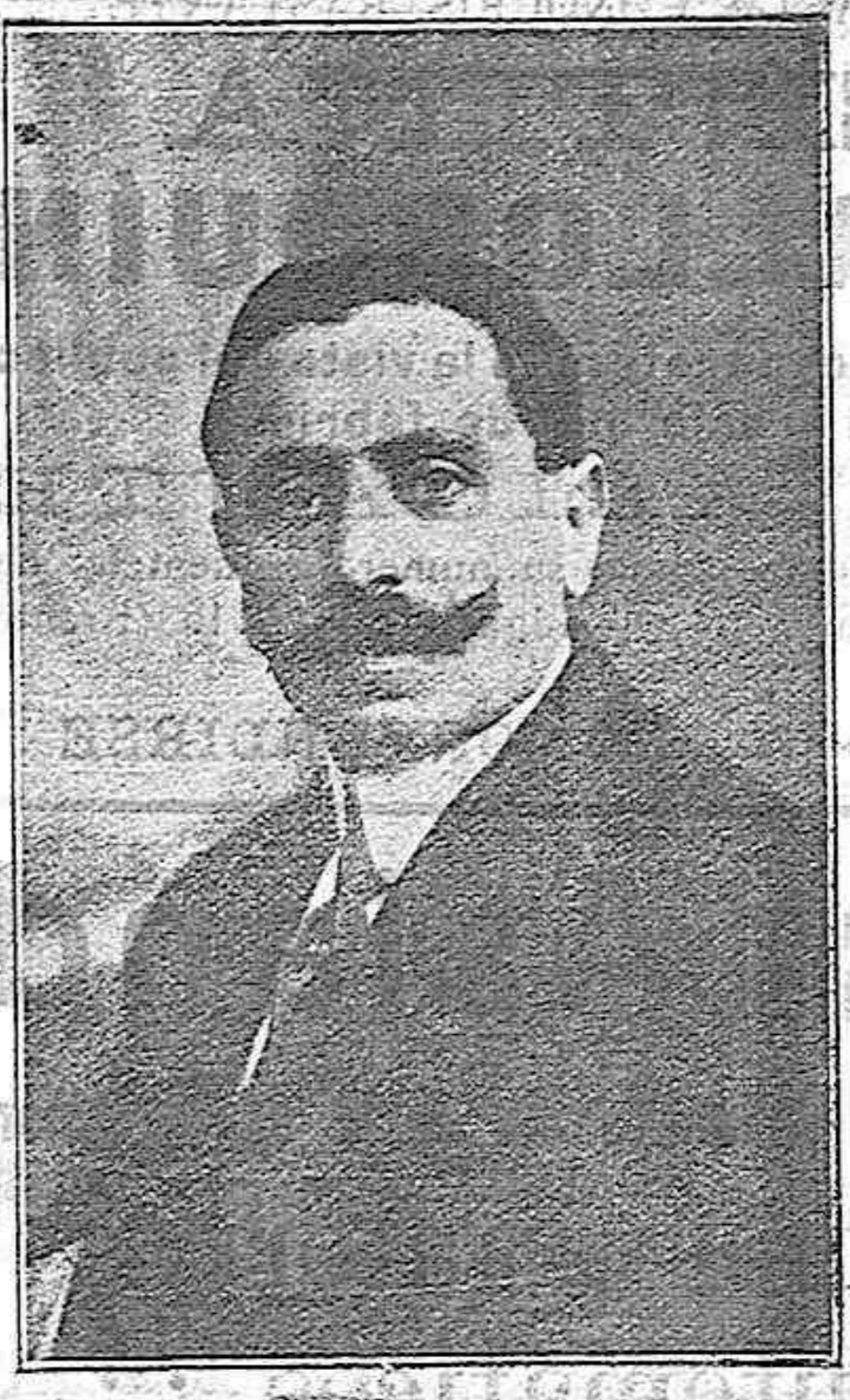
El salto de la muerte

Esa es mi manera de enseñar, y no presento ningún perro al público hasta que no veo que él está convencido que tiene que trabajar; aún así Dios sabe lo que yo sufro cuando están trabajando, a pesar de tener la seguridad que lo tienen que hacer bien; pero una distracción, un movimiento brusco en el escenario, cualquier tontería puede