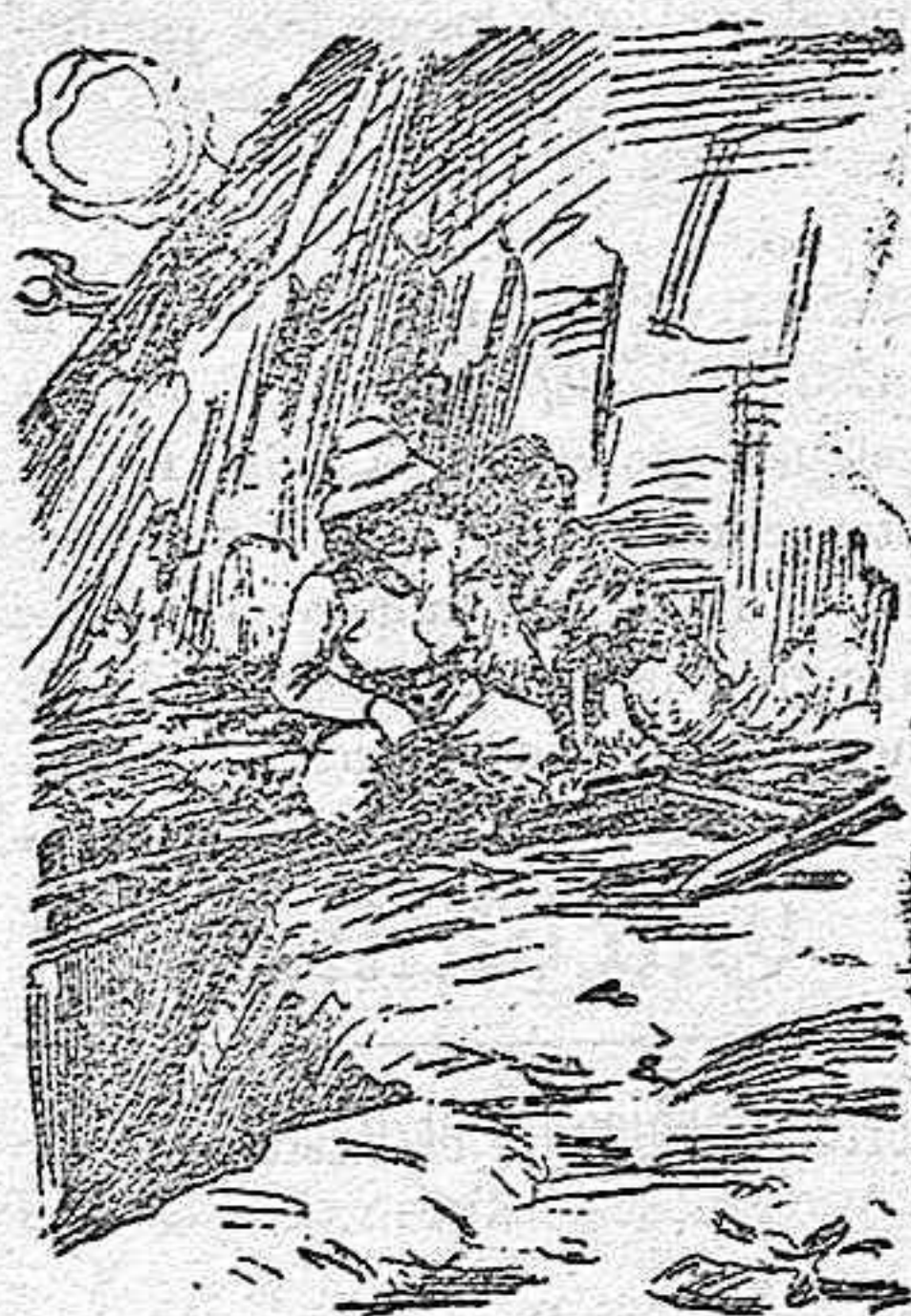
El general Hamilton en compañía de uno de los perros cogidos á los japoneses en la batalla de Shaho.