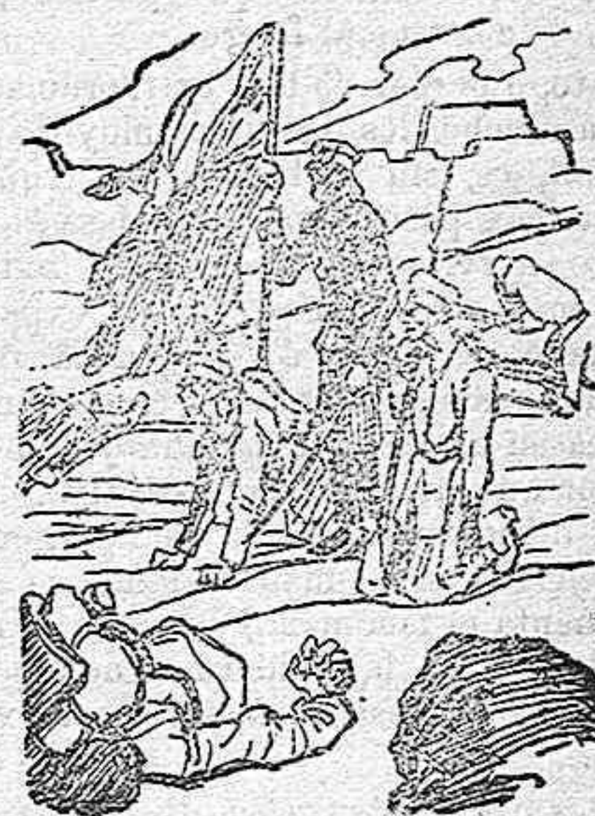
Lo que quedará al final de la guerra, de los dos ejércitos contendientes.

fundamentos de una preconizada alianza. En la estación ferroviaria le reciben solamente dos comisionados de Loubet, y el embajador inglés; pero el público parisién es siempre impresionable y apasionado: vé en la nueva visita de Eduardo, el preindio de las fiestas que dentro de algunas semanas han de celebrarse en Br-st y en Portsmouth, y saluda al monarca inglés con entusiastas aclamaciones.