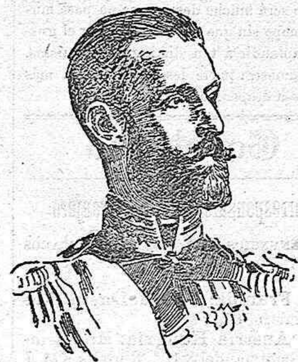
El Gran Duque Sergio, ASESINADO EN MOSCOU.

Nació el Gran Duque Sergio en 29 de Abril de 1857, en el palacio de Tsarskoie-Selo; tenía ahora, pues, cuarenta y siete años.