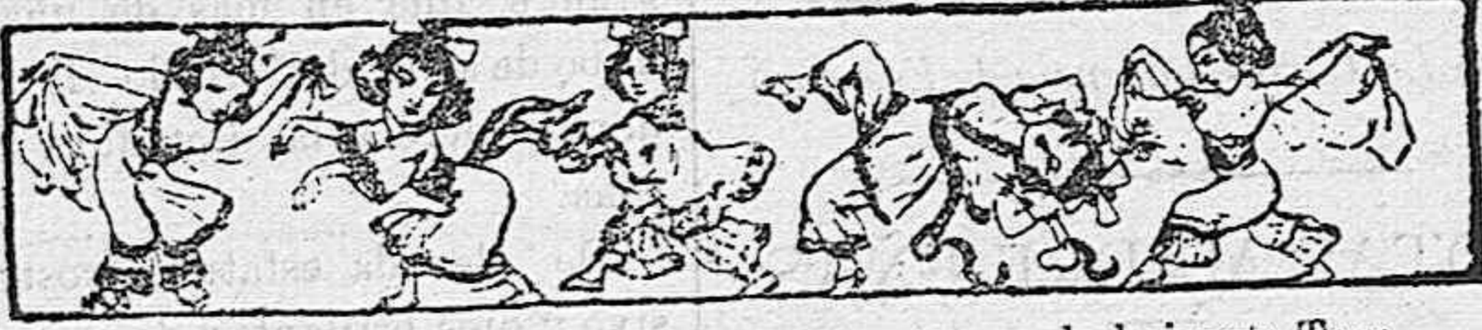
Gran baile de torpedos volantes, compuesto por el almirante Togo.