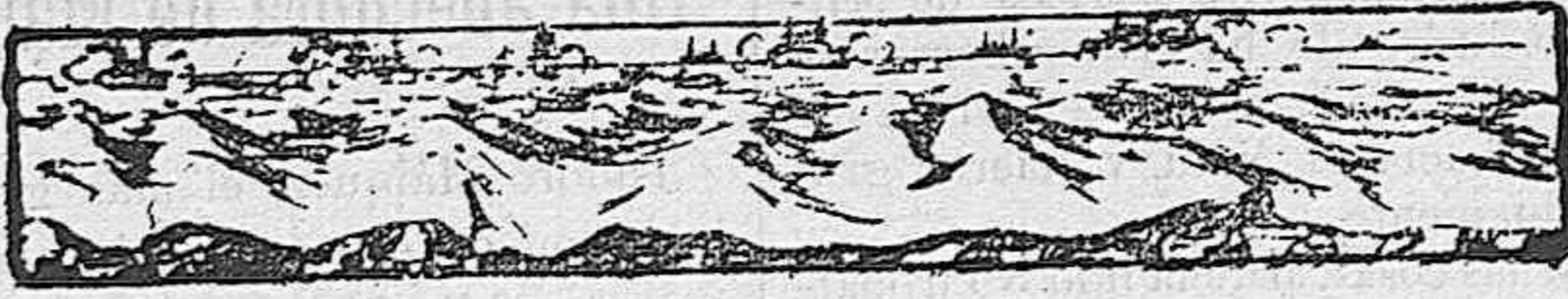
Ataque de Port Arthur. (La dirección ha reglamentado el movimiento de las olas.)