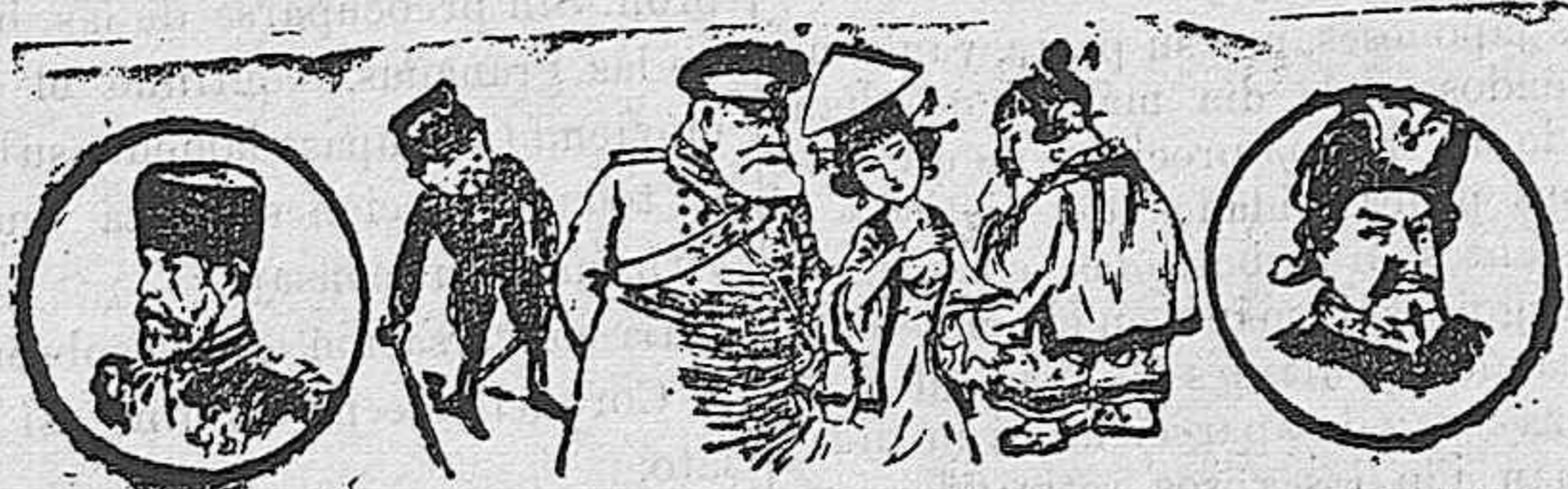
Sr. Nicolás. El amante de corazón. El Virrey. Koré. La característica. El Sr. Mikado.