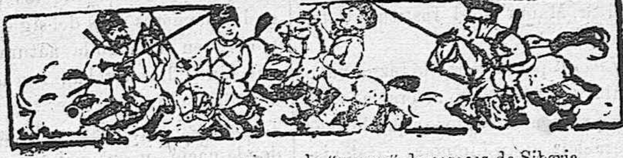
Gran pantomima ecuestre por la "troupe" de cosacos de Siberia, arreglada por el general Kouropatkine.