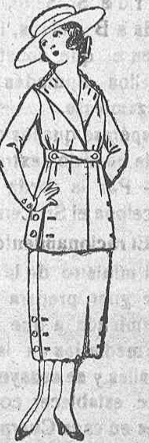
Trajes estambre o sarga inglesa, en azul o color, para jovencitas, de 12 a 15 años. de ptas. 55 a 65