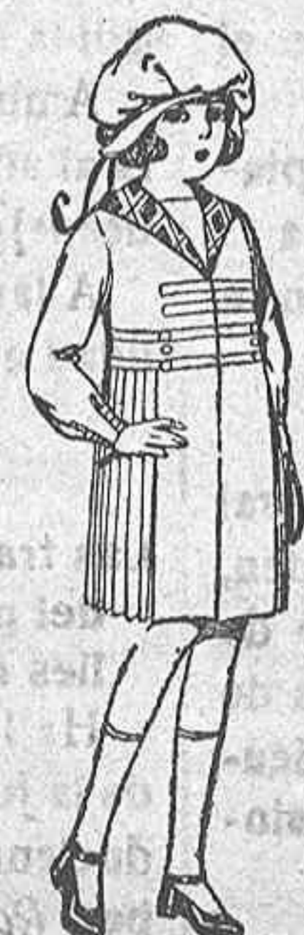
Vestidos de lanilla, adornos lana a cuadros, para niñas de 4 a 9 años. de ptas. 24 a 32