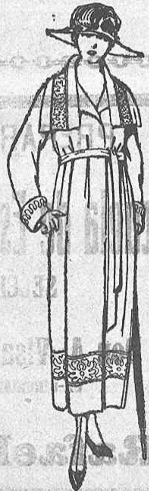
Abrigos de punto de lana, en azul o color, adornos bordados, de ptas. 135 a 180.