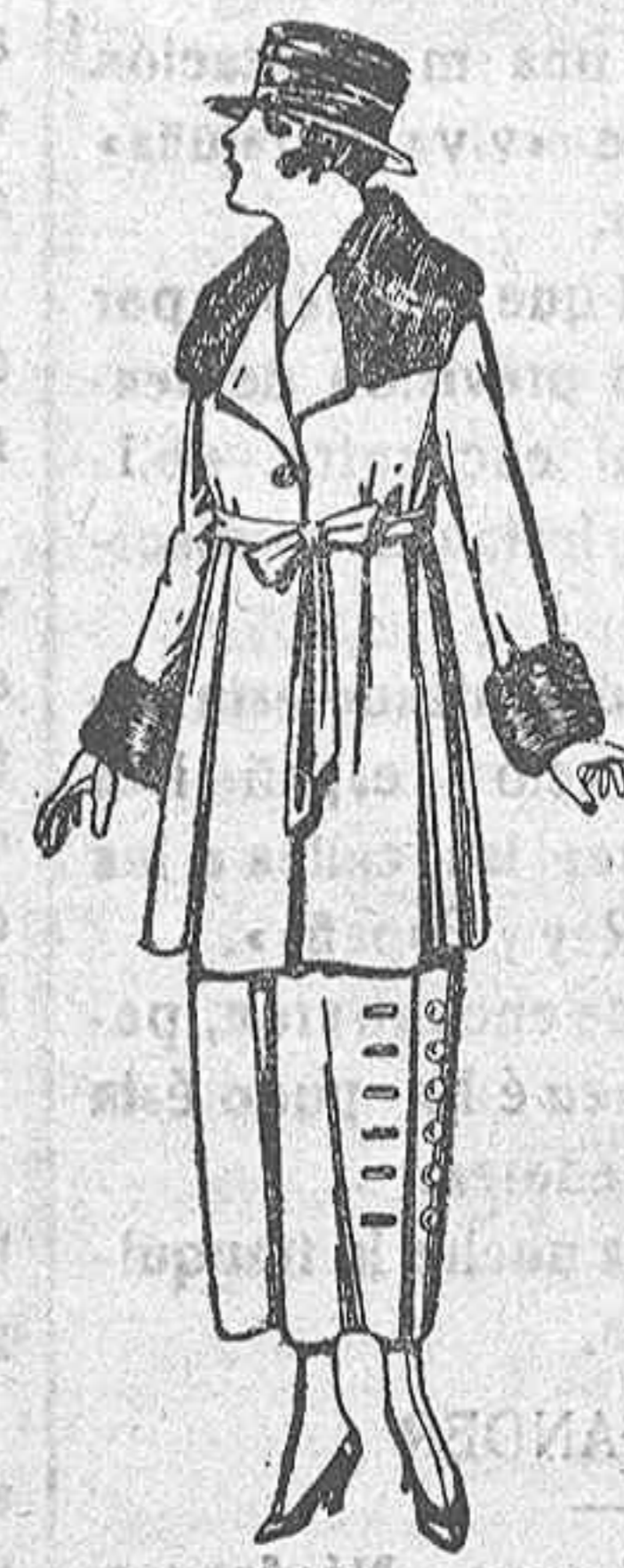
Trajes de lanilla, gabardina, ect., azul y color, cuello y bocamangas piel, de ptas. 110 a 140.