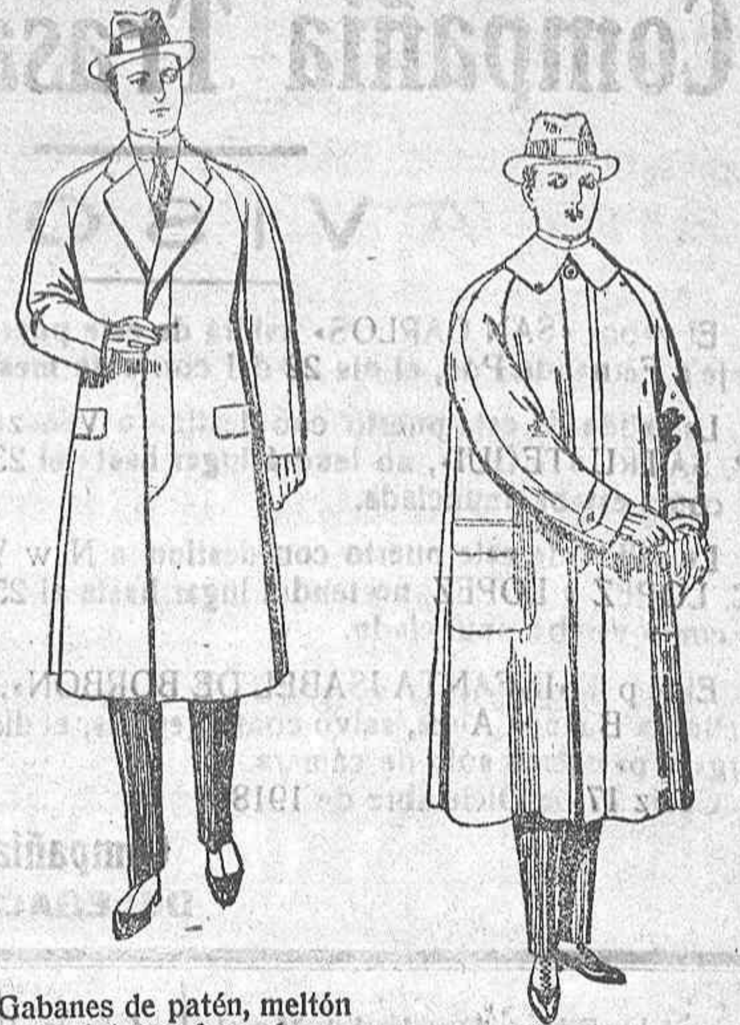
Gabanes de patén, melton o cheviot, con forro de seda, satén o escocés, a medida de ptas. 85 a 200.