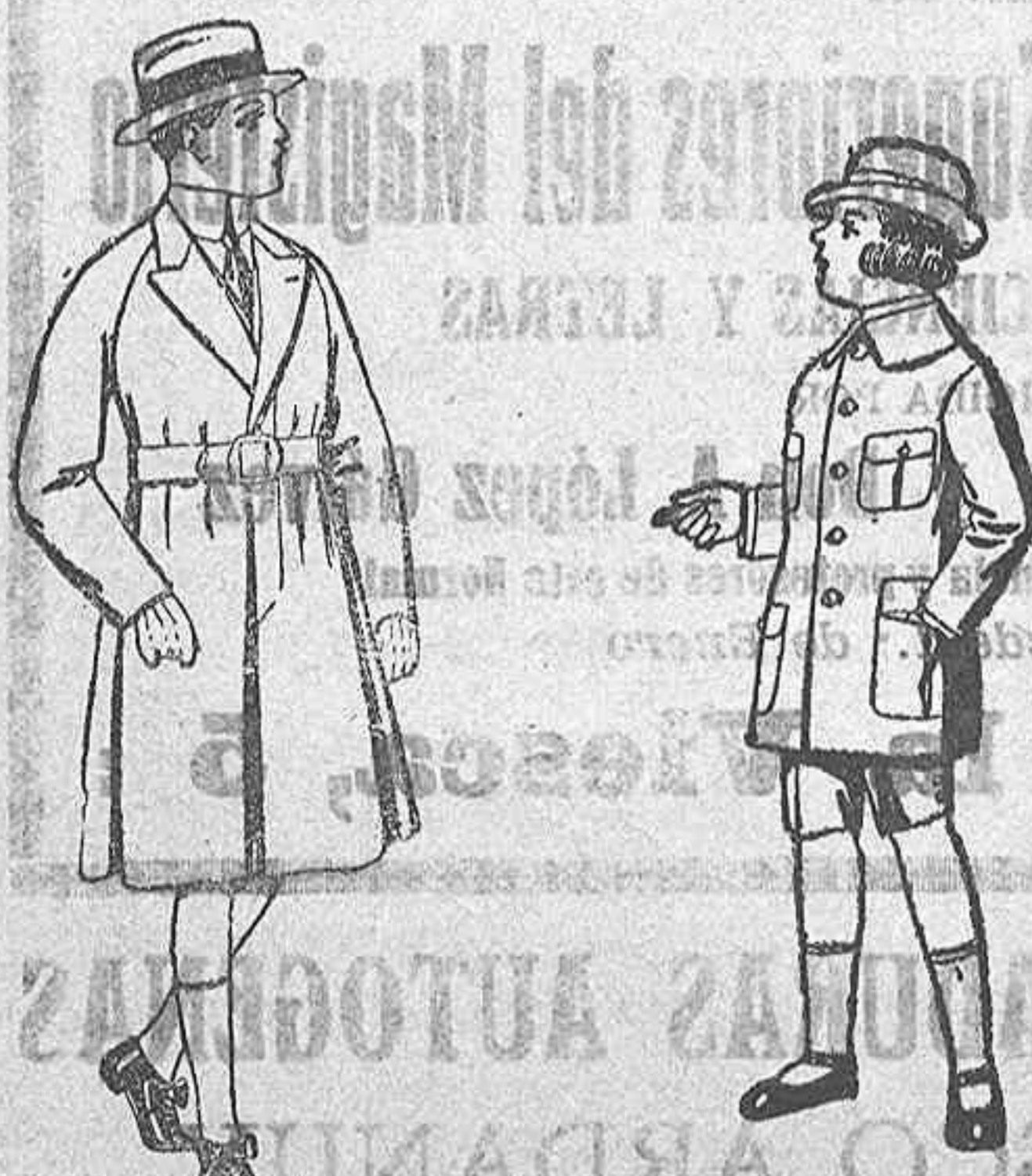
Gabanes de patén, para niños de 4 a 9 años. De ptas. 16 a 50.