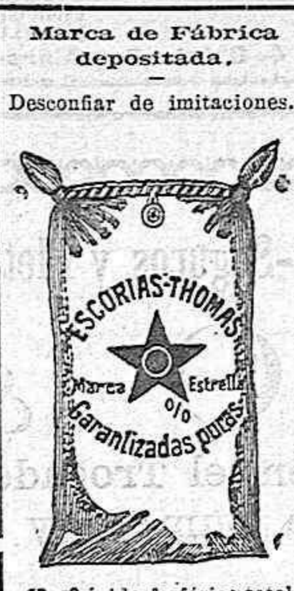
13.º ácido fosfórico total.

ESCORIAS THOMAS marca estrella CLOURURO DE POTASA SULFATO DE POTASA KAINITA SULFATO, AMONIACO NITRATO DE SOSA SUPERFOSFATO DE CAL AZUFRES Y CALDO BORDELES SCHLOSING