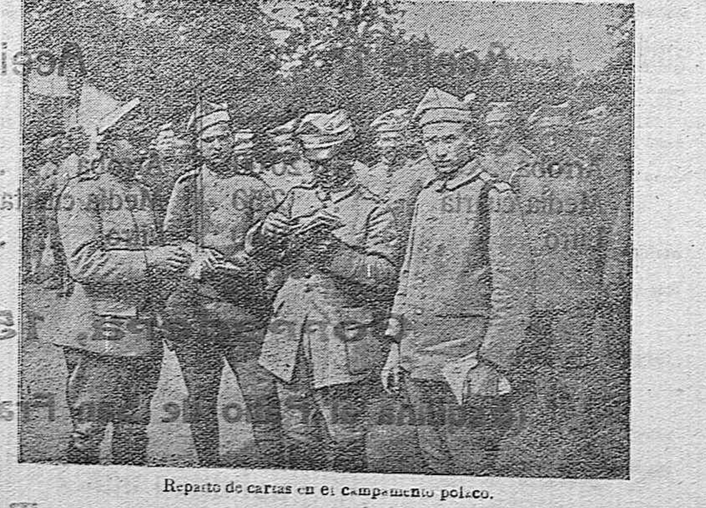
Reparto de cartas en el campamento polico.