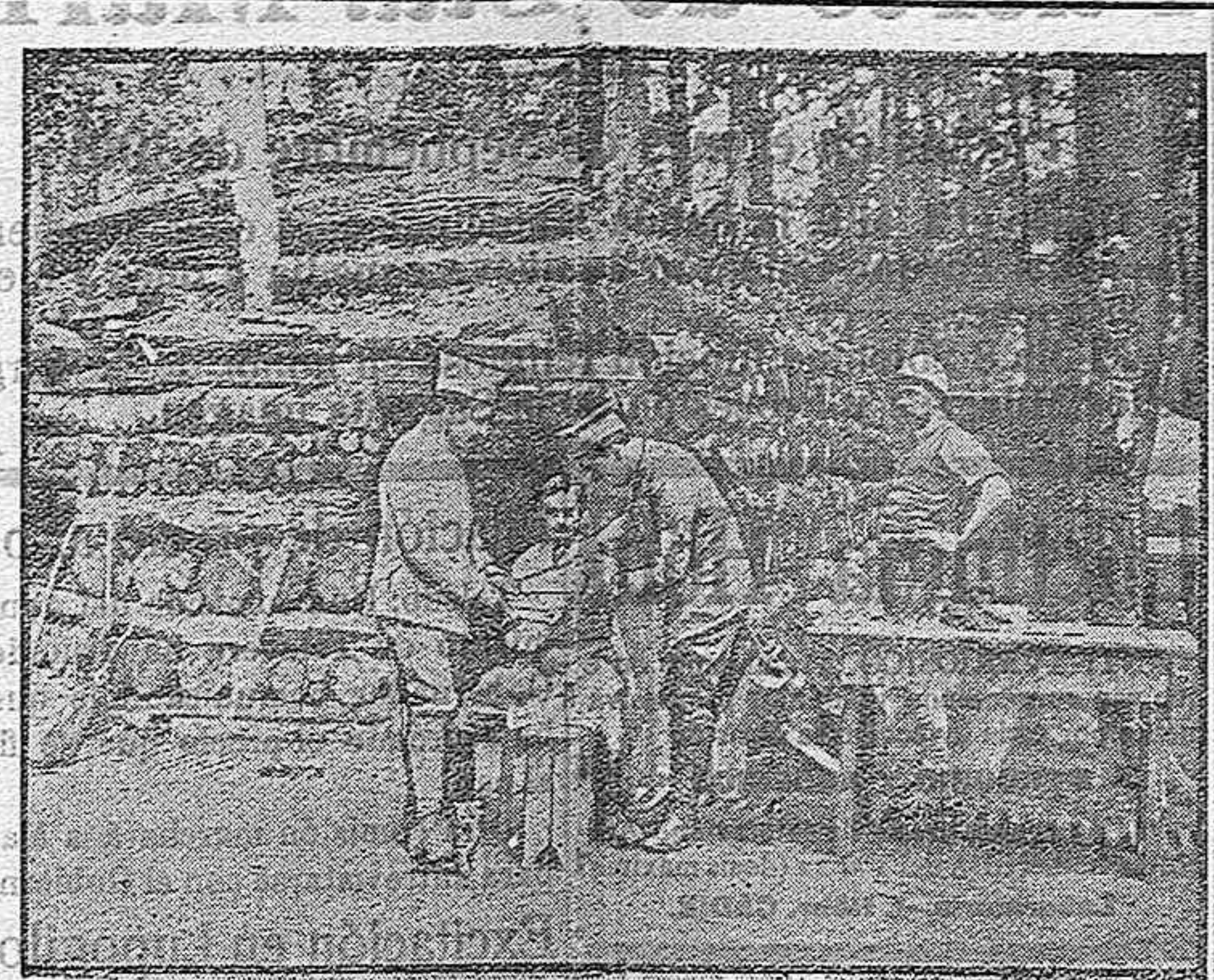
Un puesto de socorro.