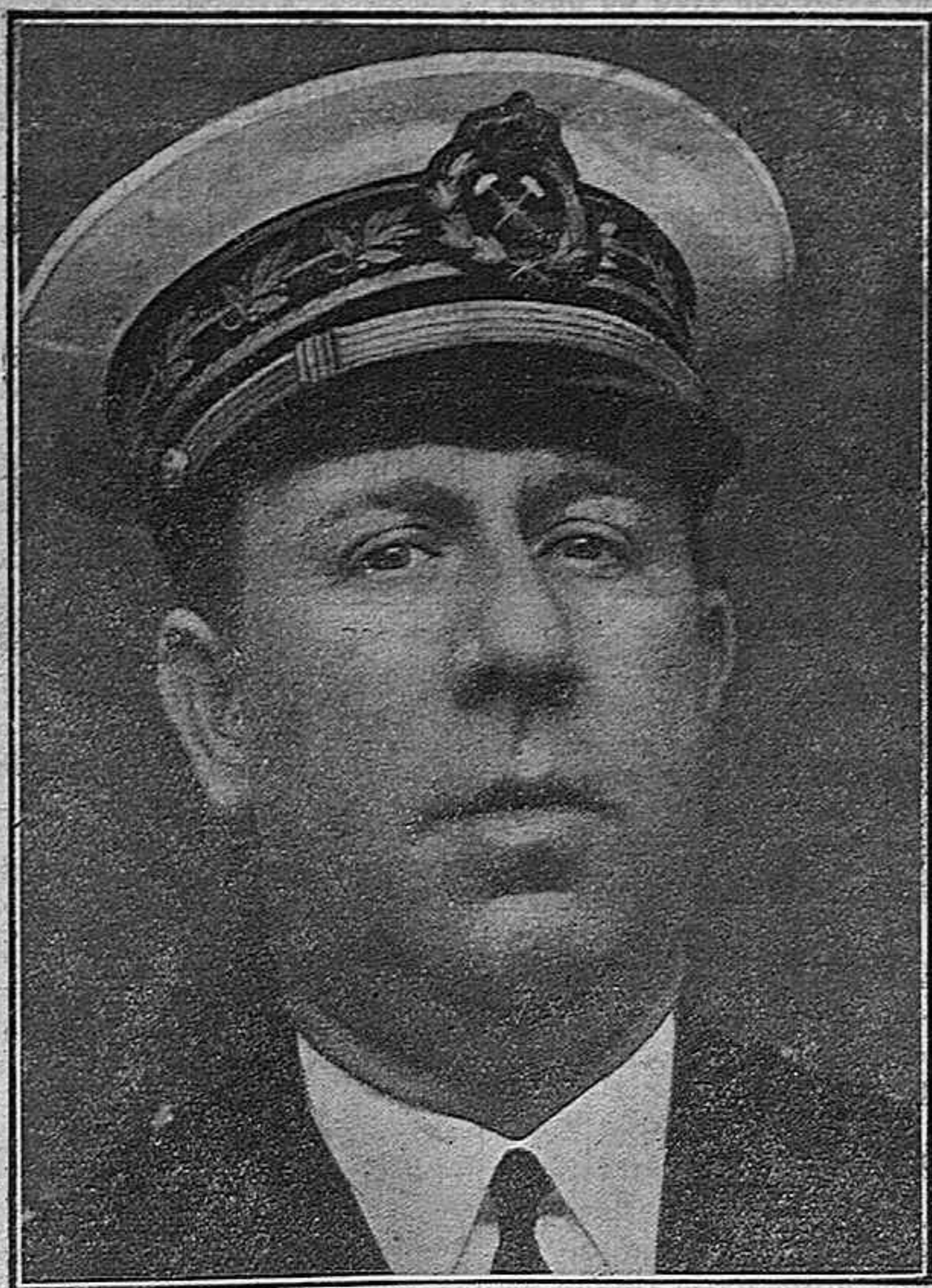
El Gobernador civil don Gustavo Morales de las Pozas, que presidió la recepción oficial, celebrada hoy, cumpleaños de S. M. el Rey