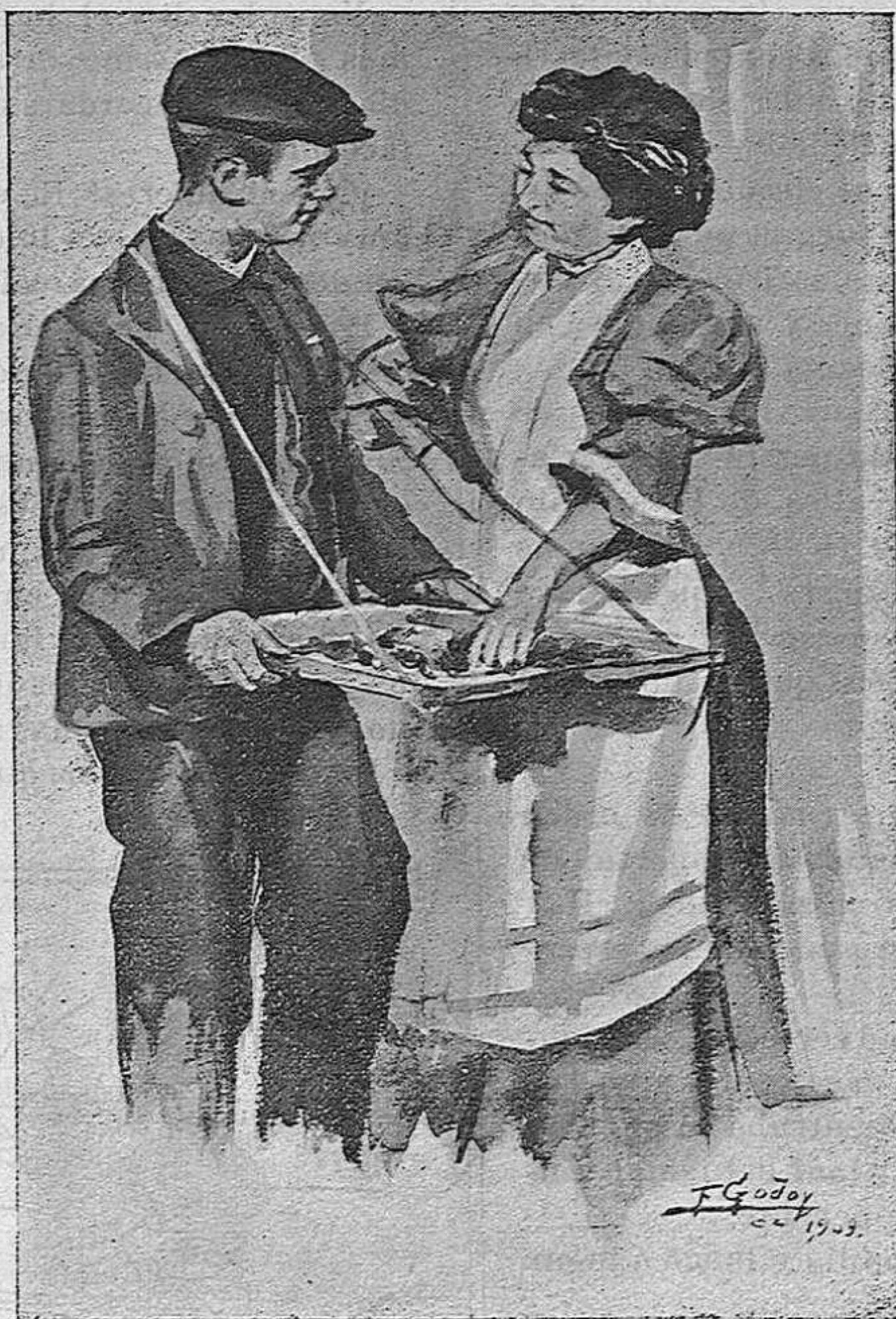
El vendedar de caramelos, por Godoy.