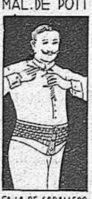
FAJA DE CABALLERO