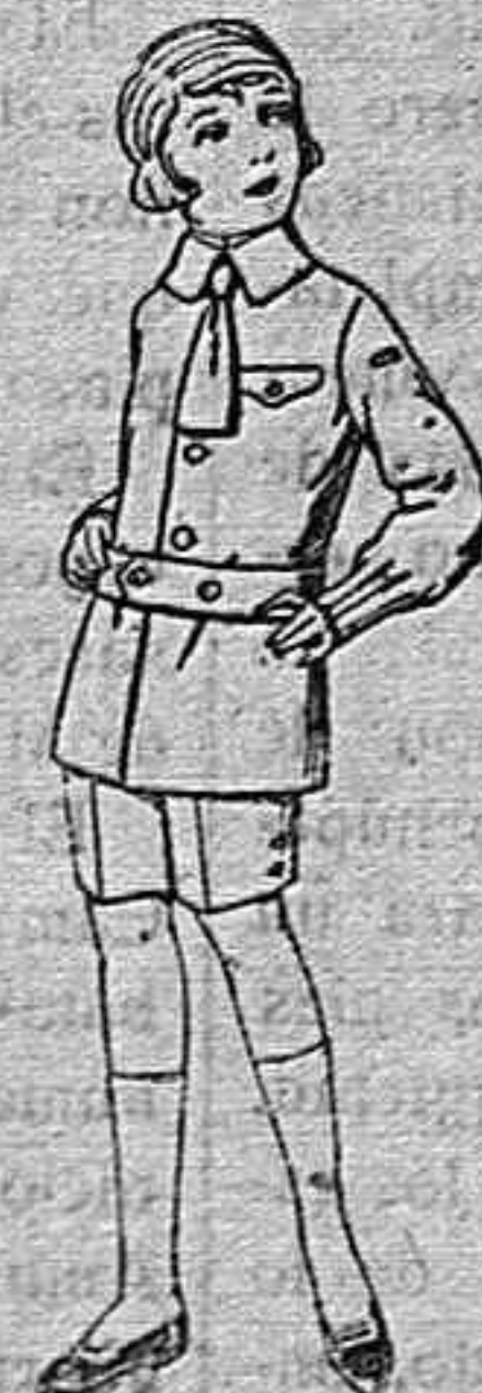
Trajes de lanilla, melton, etc., para niños de 4 a 9 años, de pesetas 15 a 25 Los mismos de dril liso o listado, de pesetas 11 a 15