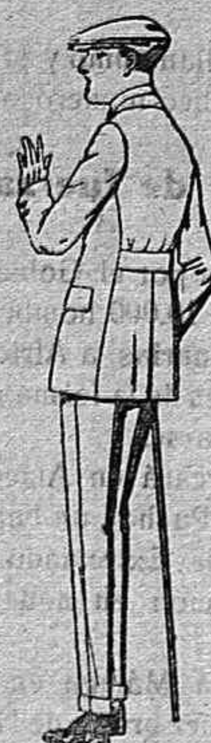
Trajes modelo Sport, de lanilla, melton, etc., para jovencitos de 10 a 16 años, de ptas. 37 a 90 El mismo modelo en dril listado, crudo o kaki, de ptas. 25 a 42