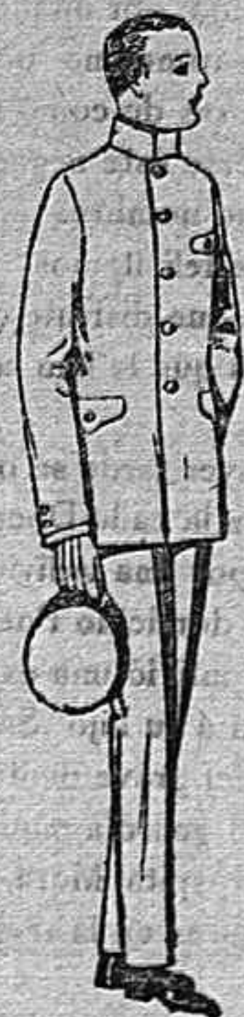
Trajes de vicuña azul o estambre gris, para grooms de 10 a 15 años, de pesetas 45 a 80 Los mismos con pantalón breeches, de ptas. 47 a 80