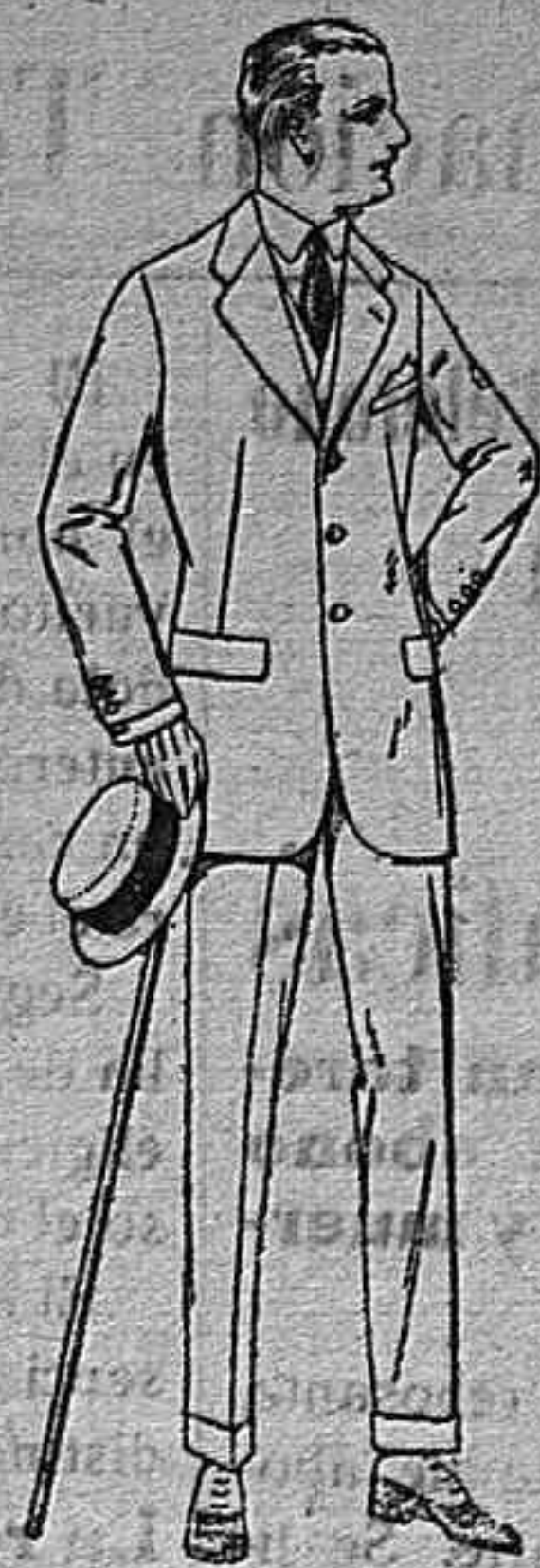
Trajes de lanilla, melton, estambre, vicuña o jerga, de ptas. 35 a 145 Trajes de dril crudo, kaki o listado, de ptas. 28 a 60