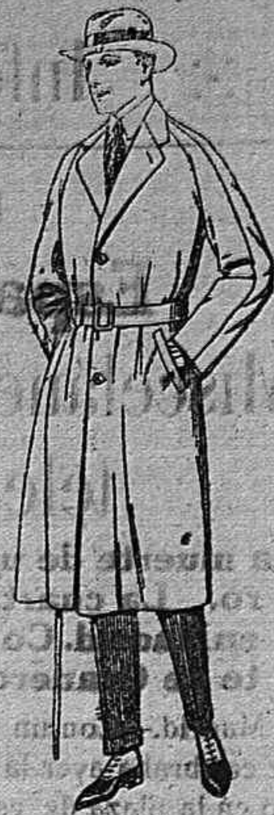
Gabanes de cheviot, cover, melton, gabardina, etcétera, de ptas. 60 a 180 Grandes existencias en géneros para gabanes a medida