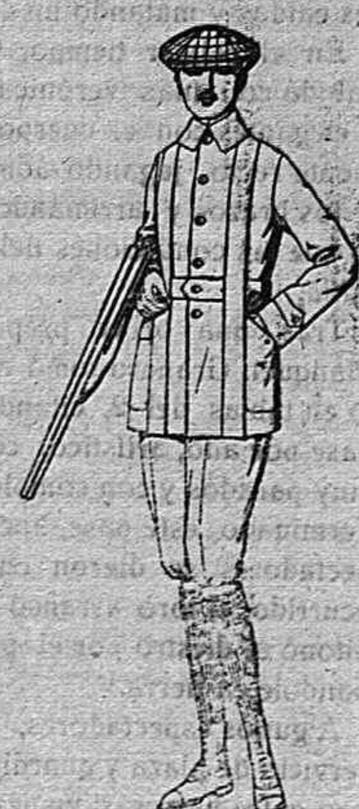
Cazadoras de dril crudo o kaki, de ptas. 18 a 30 Pantalones cortos, para excursionistas, de dril, beige o gris, de ptas. 10 a 18