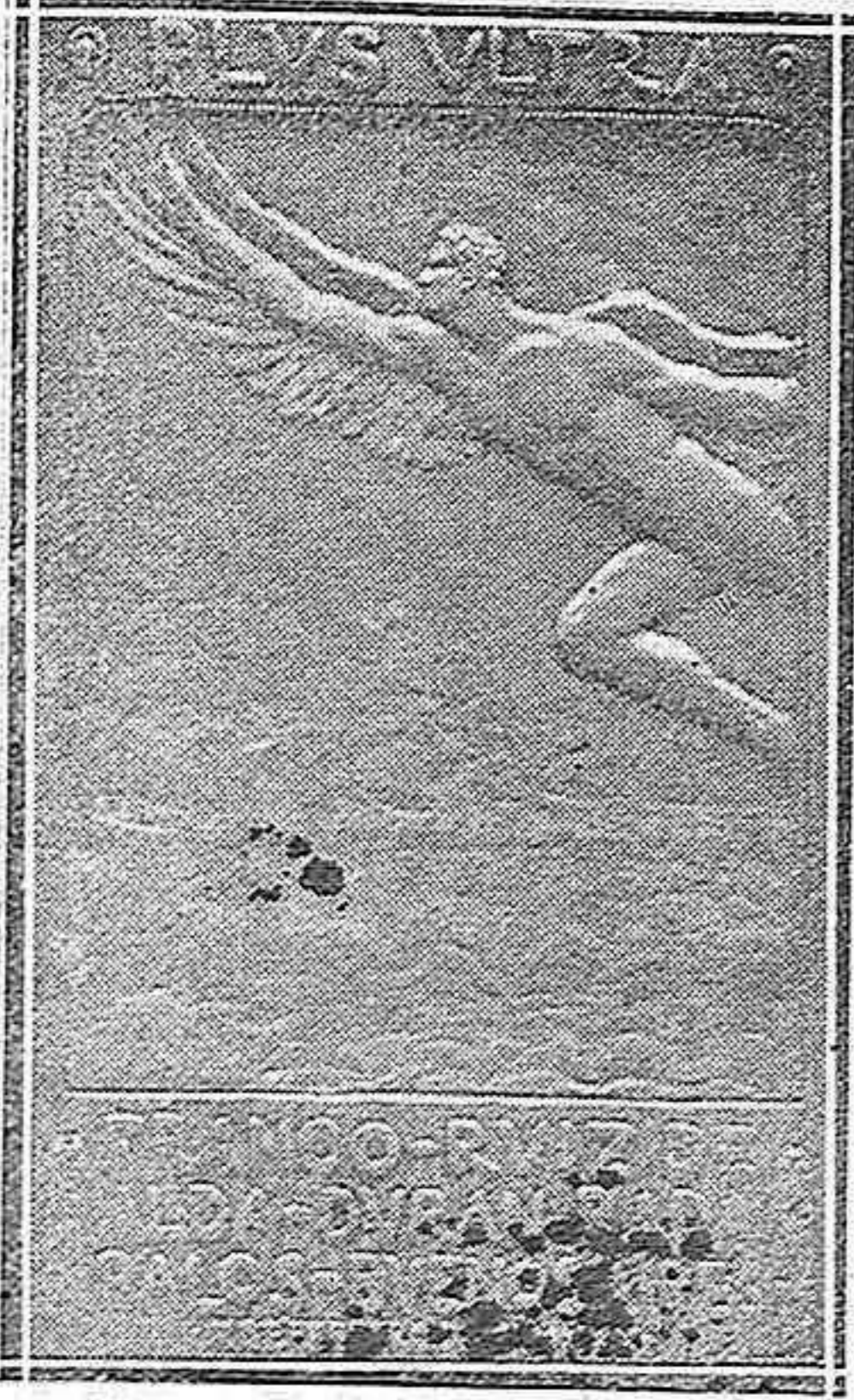
Reproducción de la artística placa de oro, obra del insigne escultor Jacinto Higuera, que por iniciativa de doña Blanca de los Ríos y en nombre de la revista «Raza española» ha sido entregada a los tripulantes del «Plus Ultra». La placa representa al genio de la raza en su viaje Palos-Buenos Aires, y en el mar, se vislumbran las carabelas de Colón, como recuerdo de la famosa epopeya.

Homenaje a los tripulantes del «Plus Ultra»