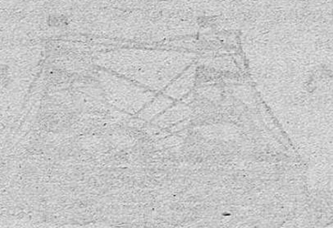
Diagrama que muestra la estructura de un cable de fierro, con los alambres individuales y el núcleo central.

El uso de cables de fierro en la construcción de puentes ha permitido la creación de estructuras más grandes y espectaculares. Los puentes de cables de fierro son conocidos por su elegancia y resistencia. Además, su construcción es más rápida y económica que la de los puentes de hormigón o acero sólido. Esto los hace muy atractivos para los gobiernos y particulares que buscan soluciones eficientes para cruzar ríos y valles. Los cables de fierro también se utilizan en la construcción de edificios altos, donde su capacidad de carga y resistencia a la tracción son fundamentales para mantener la estructura estable. En resumen, los cables de fierro son un material versátil y esencial para la construcción moderna. Su uso adecuado garantiza la seguridad y durabilidad de las obras de ingeniería.