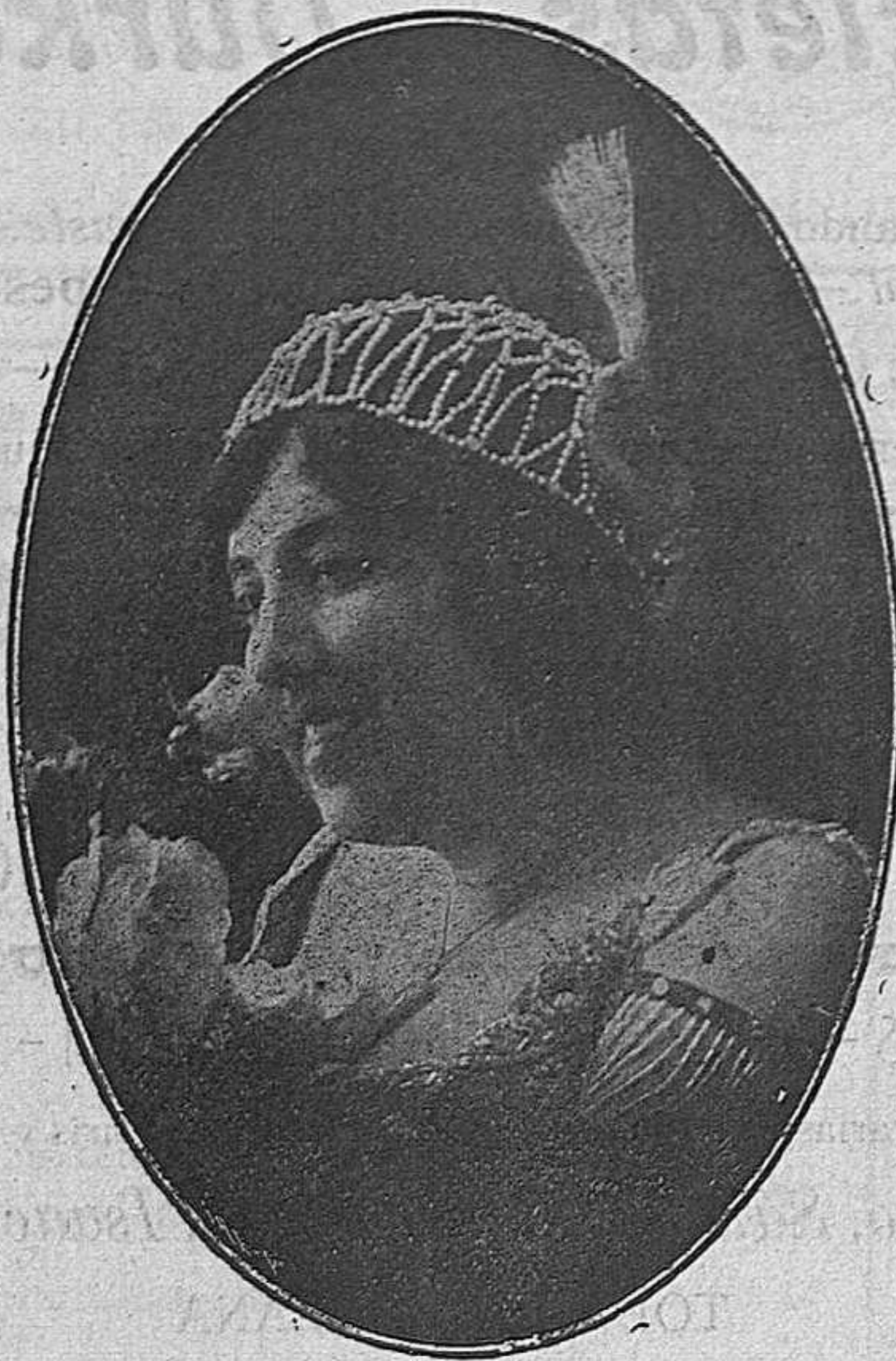
La afamada canzonetista LA TOSCANA