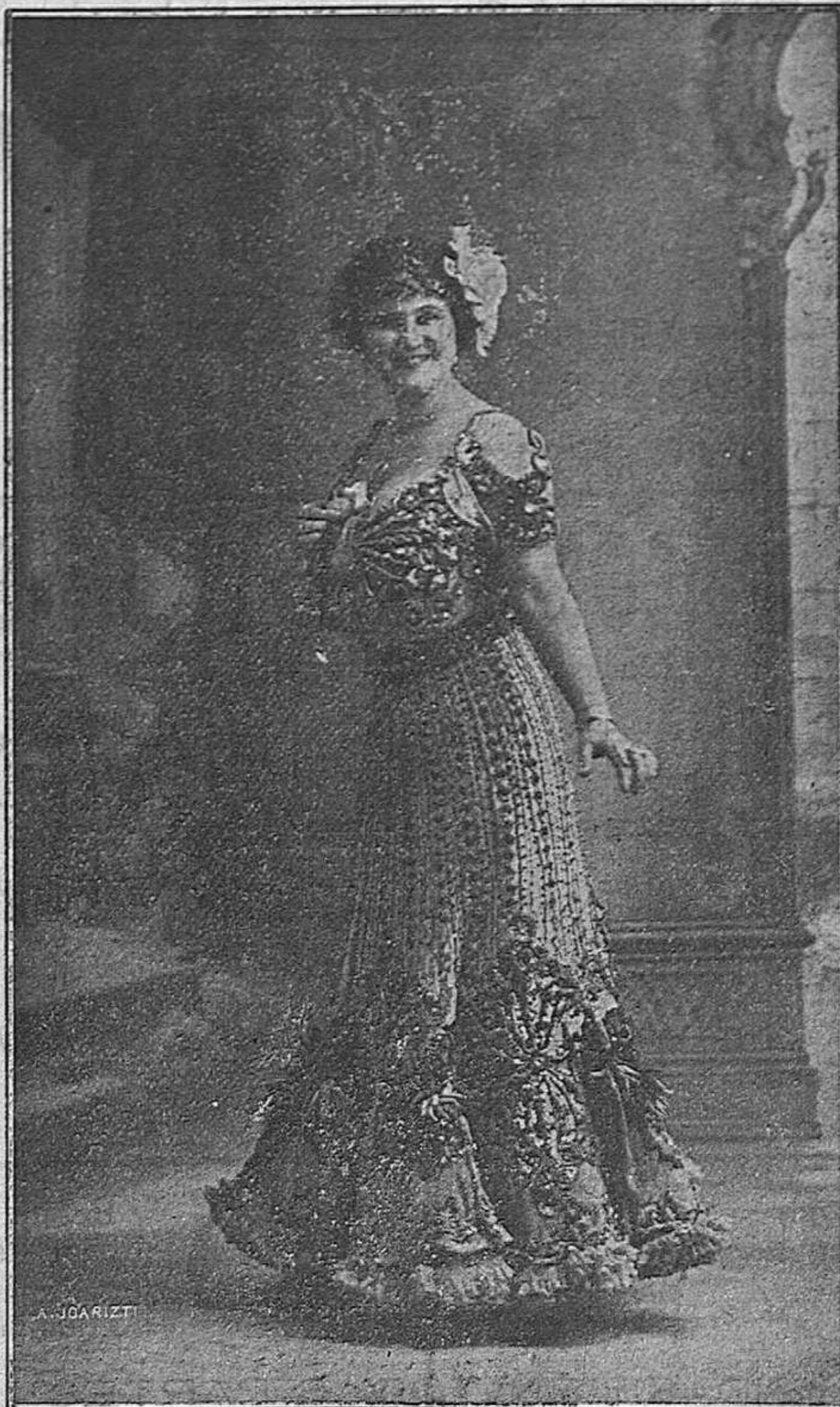
La aplaudida canzonetista CARMEN FLORES